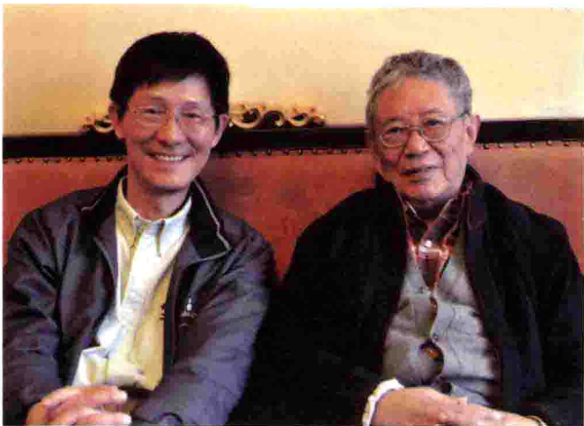
2010年10月18—19日，李泽厚、刘绪源在北京对谈。