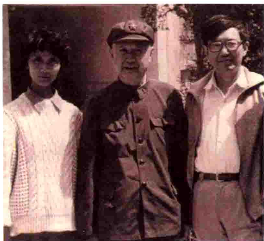
1984年钱学森(中)来和平里九区一号院，左右为李氏夫妇，摄影者为钱的随行人员。