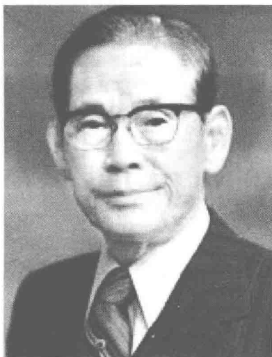
三星创始人李秉喆