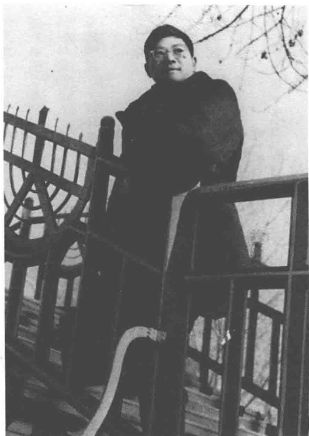
一九五六年出差到哈爾濱，「借頭借路去玩」，攝於哈爾濱兆麟公園。