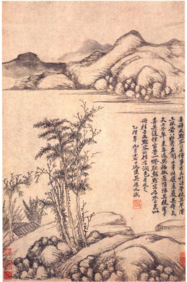
吳歷 仿古山水圖 之一、之二