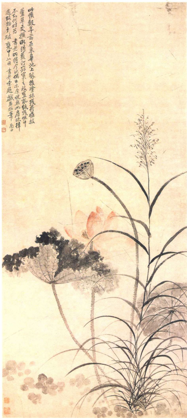
惲壽平 荷花蘆草圖