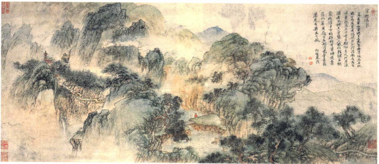
黃向堅 尋親紀程圖 局部