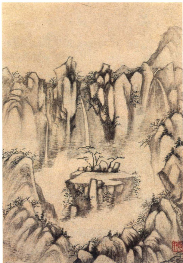
楊文驄 雁蕩八景圖 之一、之二