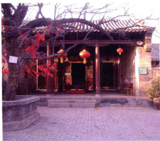
获嘉武王庙武王大殿