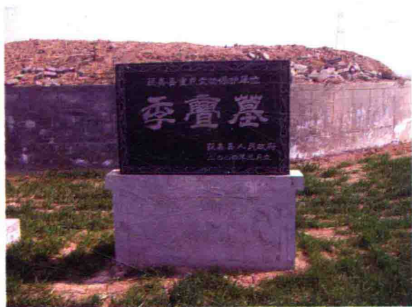
宁姓得姓始祖季贗墓