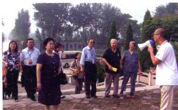
2011年8月，中 国·获嘉周武王与牧野大 战研讨会专家考察武王庙