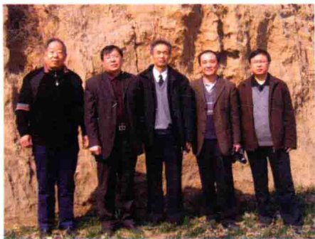
2008年3月，获嘉第二届宁氏文化研讨会筹备期间河南省社科院历史与考古所专家与宁姓宗亲一起考察齐州故城遗址