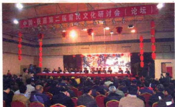
2008年3月，中国·获嘉第二届宁氏文化研讨会会场