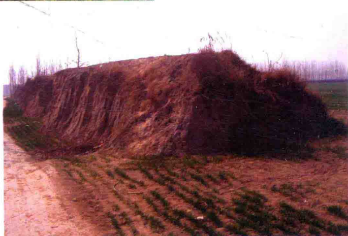
获嘉齐州故城遗址