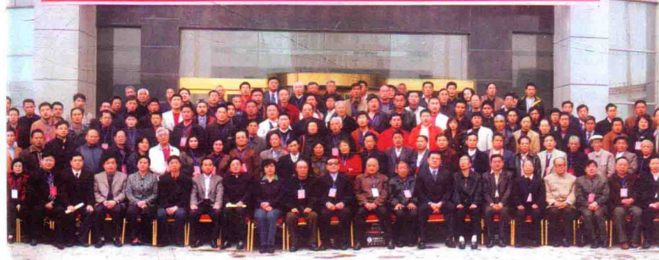
2008年3月，中国·获嘉第二届宁氏文化研讨会暨首届全球宁氏寻根祭祖大典与会专家、宗亲合影

热烈祝贺全球宁氏宗亲来获嘉寻根祭祖、“中国·获嘉第二届宁氏文化研讨会（论坛）”成功举办