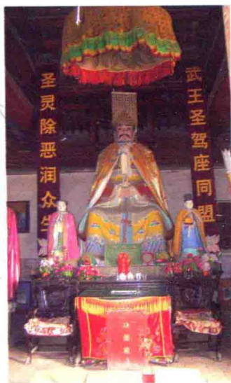
获嘉武王庙武王塑像