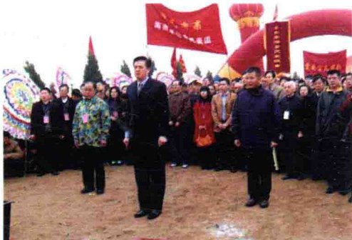
2008年3月，获嘉首届全球宁氏寻根祭祖大典宁氏宗亲祭拜现场