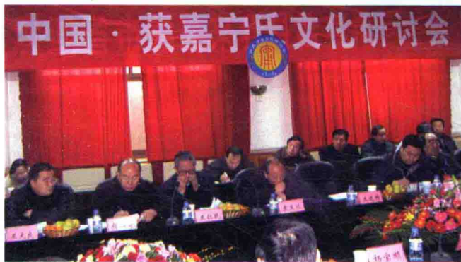
2005年12月，中国·获嘉宁氏文化研讨会会场