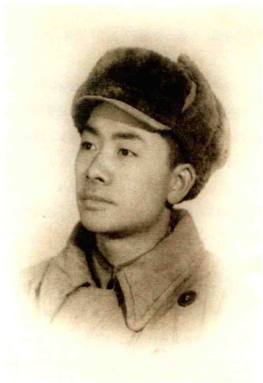
◎ 那时候的我爹，乐队指挥，各种乐器都玩得转，颇有文艺范儿