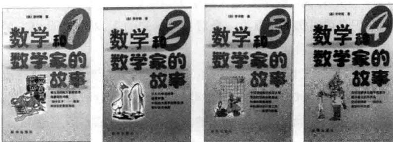
新华出版社的《数学和数学家的故事》

此书在香港、台湾及大陆内地得到许多人的喜爱。新华出版社在 1995 年把第一册到第七册汇集成四册，发行简体字版。