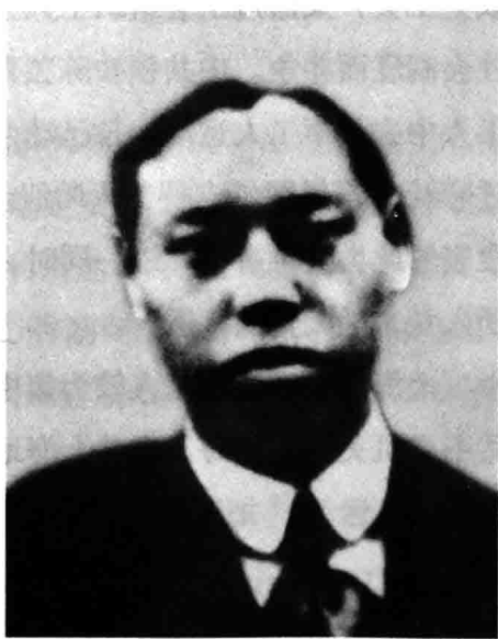
■ 李立三（摄于20世纪50年代），顾顺章的革命引路人和入党介绍人之一。