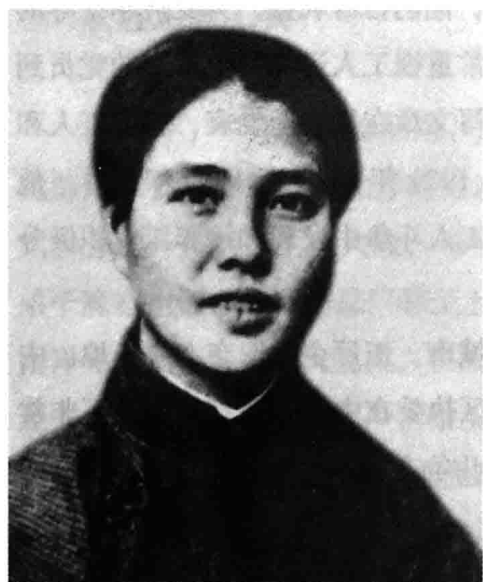
■ 向警予（摄于20世纪30年代），顾顺章革命的引路人和入党介绍人之一。

1924年9月，南洋兄弟烟草公司总厂由于在上海盲目发展，以及经营管理不善，导致盈利下降。前南洋兄弟烟草公司职工会会长，时任