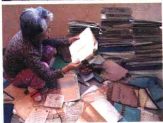
“耗”在散不尽霉味的 手稿、日记里