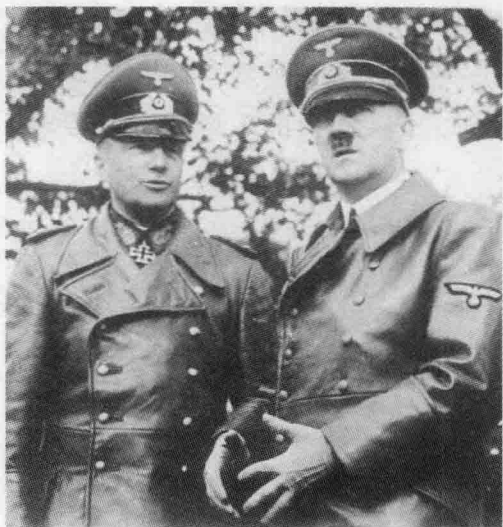
⊙ 瓦尔特·冯·布劳希奇（左）和希特勒（右）在华沙

国防军最高统帅部（Oberkommando der Wehrmacht，简称OKW）是德国国防军的最高指挥机关，下设陆军总司令部（Oberkommando des Heeres，简称OKH）、海军总司令部（Oberkommando der Kriegsmarine，简称OKM）、空军总司令部（Oberkommando der Luftwaffe，简称OKL）。二战期间，阿道夫·希特勒（Adolf Hitler，1889年4月20日～1945年4月30日）担任德国国防军总司令，其自杀后由卡尔·邓尼茨（Karl Doenitz，1891年9月16日～1980年12月24日）接任。由于希特勒喜欢干涉陆军事物，导致