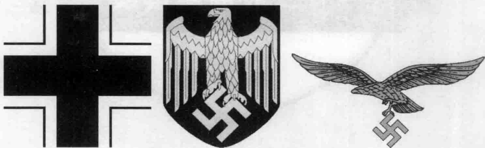
⊙ 德国国防军陆军、海军和空军的标志

二战期间，德国的正式军事力量称为德国国防军（Wehrmacht），这是战争期间德国最重要的武装力量。德国国防军的前身为1921年1月1日成立的德国防卫军（Reichswehr），1935年10月15日正式更名为德国国防军。德国国防军有国防军陆军（Heer）、国防军海军（Kriegsmarine）和国防军空军（Luftwaffe）三大军种，总人数约2000万，其中陆军的规模最大，占国防军总人数的四分之三。