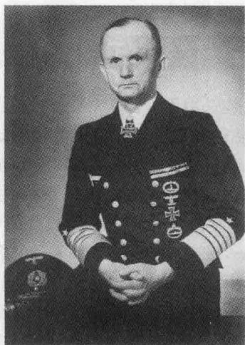
④ 埃里希·雷德尔戎装照