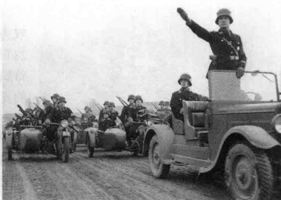
⊙ 党卫队机械化部队

希特勒的卫队和对付政敌的工具而存在，规模很小。直到1929年1月由希姆莱领导后，党卫队才有了较大的发展，到1933年初已发展至5万余人。1934年6月30日，冲锋队领袖罗姆及其亲信在“长刀之夜”被处决以后，党卫队在纳粹恐怖组织中起主导作用，由希特勒重新掌管。1935年3月16日，德国恢复义务征兵制，希特勒下令成立完全军事化的党卫队组织，也就是党卫队特别机动部队。1940年，党卫队特别机动部队改称“武装党卫军”。在鼎盛时期，武装党卫军拥有38个师和其他小型单位，涵盖装甲师、装甲掷弹兵、骑兵、步兵、山地步兵和警察部队等。