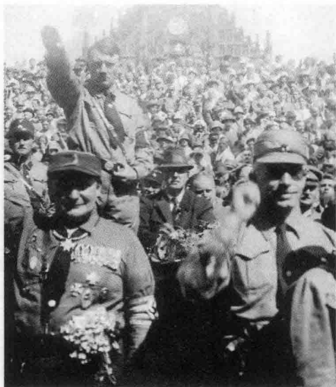
⊙ 狂热的冲锋队成员

普通国民组织。二战期间，冲锋队负责维护德国本土与一部分占领区，1945年战争结束后被解散。