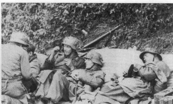
④ 德国陆军士兵在苏联境内行军