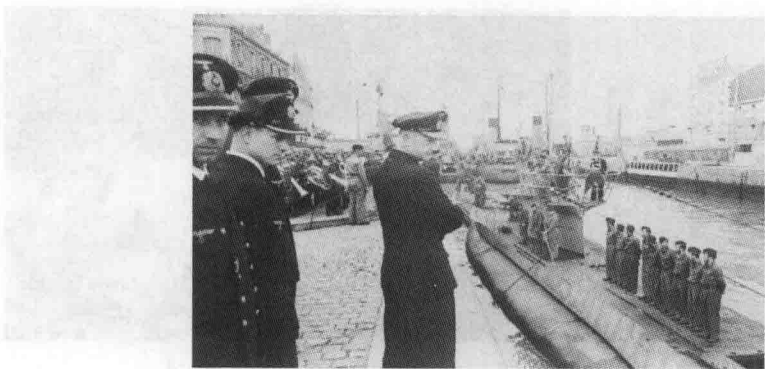
⊕ 卡尔·邓尼茨检阅海军潜艇部队