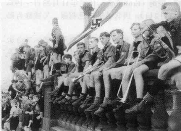
⊙ 1933年5月1日柏林的希特勒青年团成员

希特勒青年团的任务是对德国青少年进行军事训练，为德国的对外战争做准备，并为纳粹党提供后备党员。希特勒青年团分为7个地区：中部、北部、东部、南部、西部、奥地利地区、苏台德地区。下分为35个大区，组织结