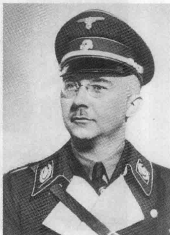
⊕ 臭名昭著的海因里希·希姆莱

党卫队（Schutzstaffel，简称SS）亦称党卫军，是德国纳粹党中用于执行治安勤务的编制之一，1925年4月成立。在成立初期，党卫队隶属于恩斯特·罗姆领导的冲锋队，仅仅作