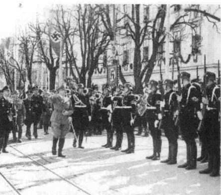
⊙ 希特勒视察党卫军