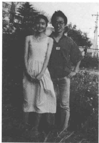
四分之一世纪前·刚刚结婚