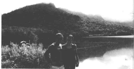
2014年夏·新罕布什尔山中