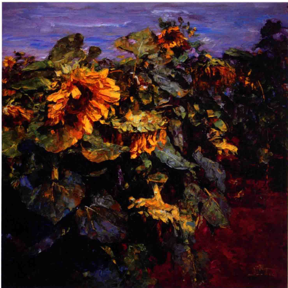
锦绣前程 100cm X 100cm 2010年 亚麻布油彩