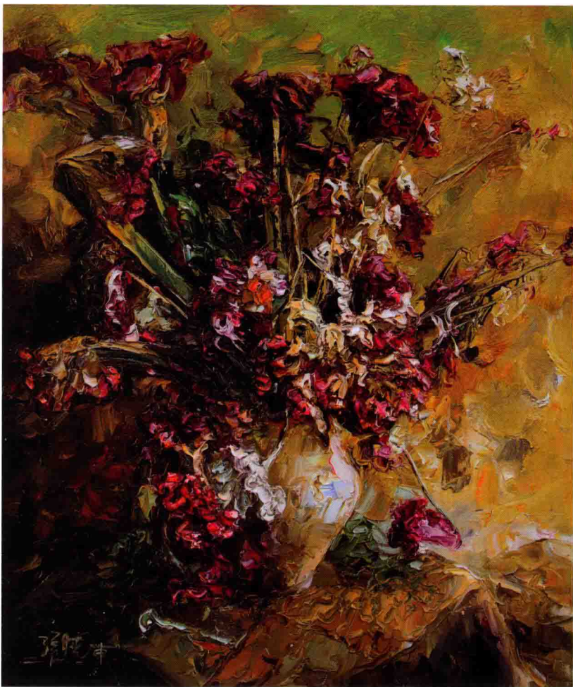
红冠静物 60cm X 50cm 2012年 亚麻布油彩