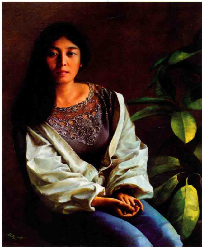
妻子的肖像 75cm×60cm 1998年 亚麻布油彩