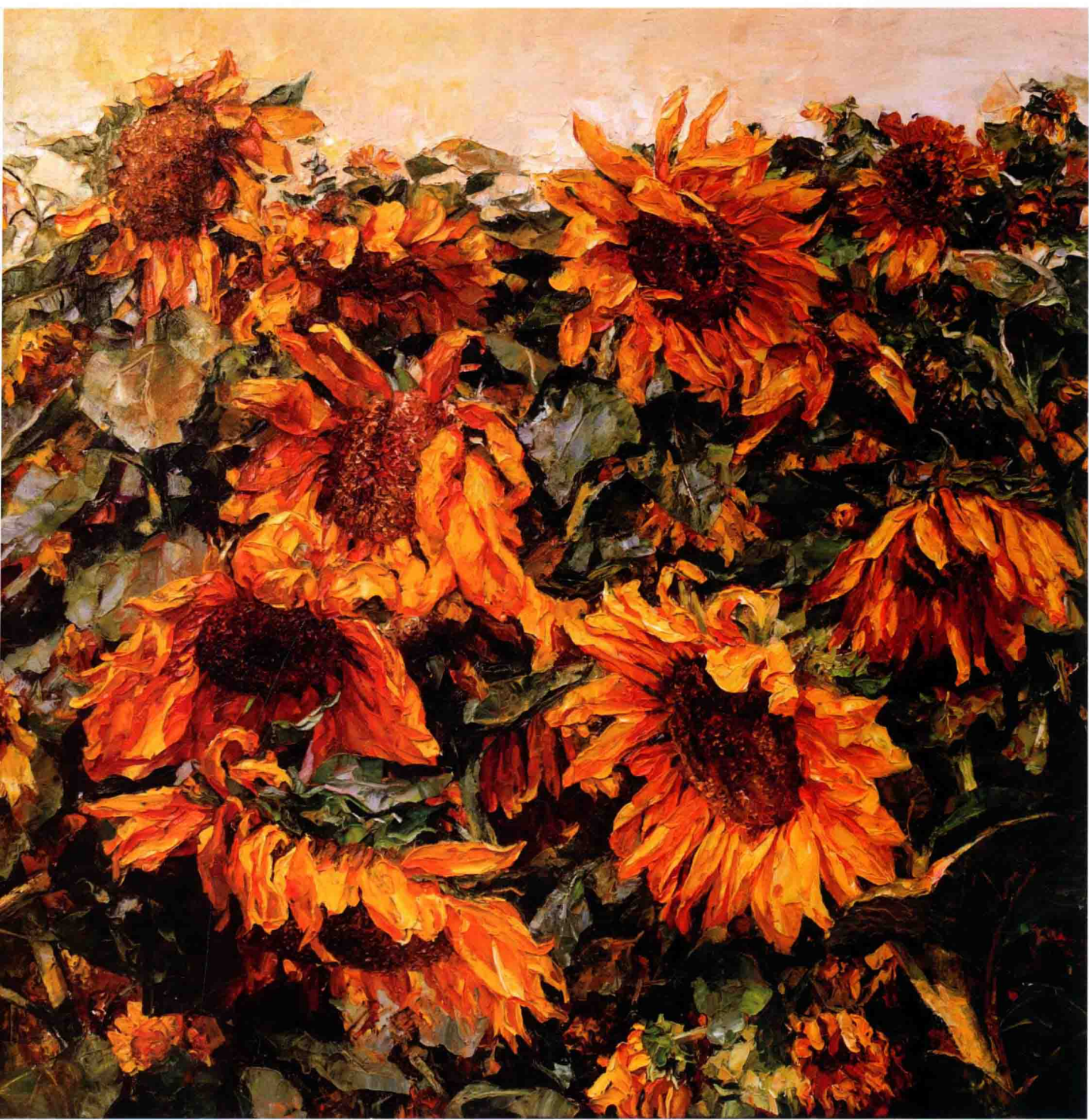
欢乐精灵 100cm×100cm 2008年 亚麻布油彩