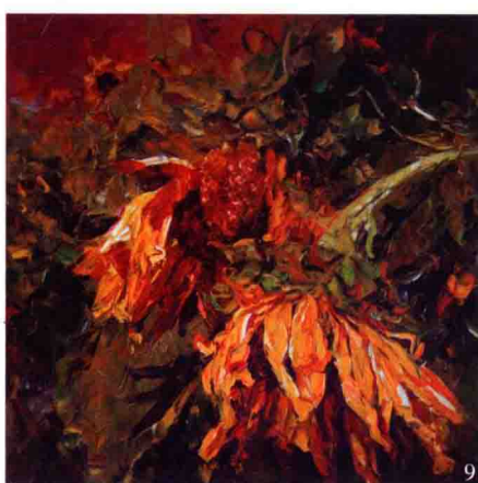
1. 彩葵系列之一 40cm×40cm 2013年 亚麻布丙烯 2. 彩葵系列之二 40cm×40cm 2013年 亚麻布丙烯 3. 彩葵系列之三 40cm×40cm 2013年 亚麻布丙烯 4. 相恋 50cm×50cm 2012年 亚麻布丙烯 5. 微风 50cm×50cm 2012年 亚麻布丙烯 6. 葵园 50cm×50cm 2012年 亚麻布丙烯 7. 情缘 60cm×60cm 2012年 亚麻布丙烯 8. 欢聚 60cm×60cm 2012年 亚麻布丙烯 9. 残阳 50cm×50cm 2008年 亚麻布油彩