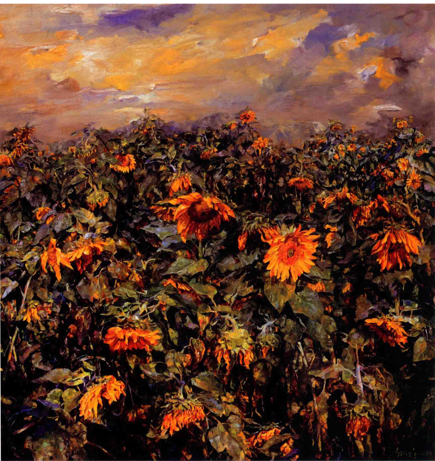
欢乐颂 180cm×180cm 2012年 亚麻布油彩