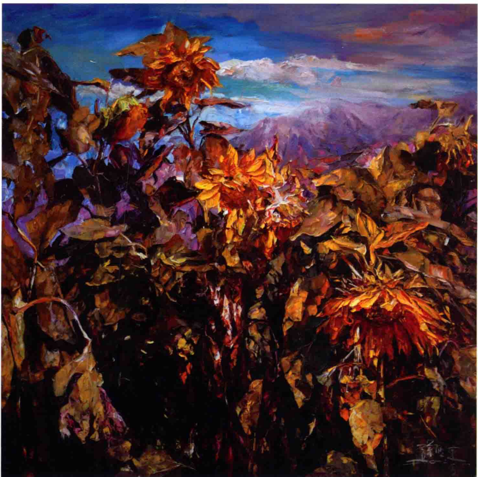
云破天青 100cm X 100cm 2012年 亚麻布油彩