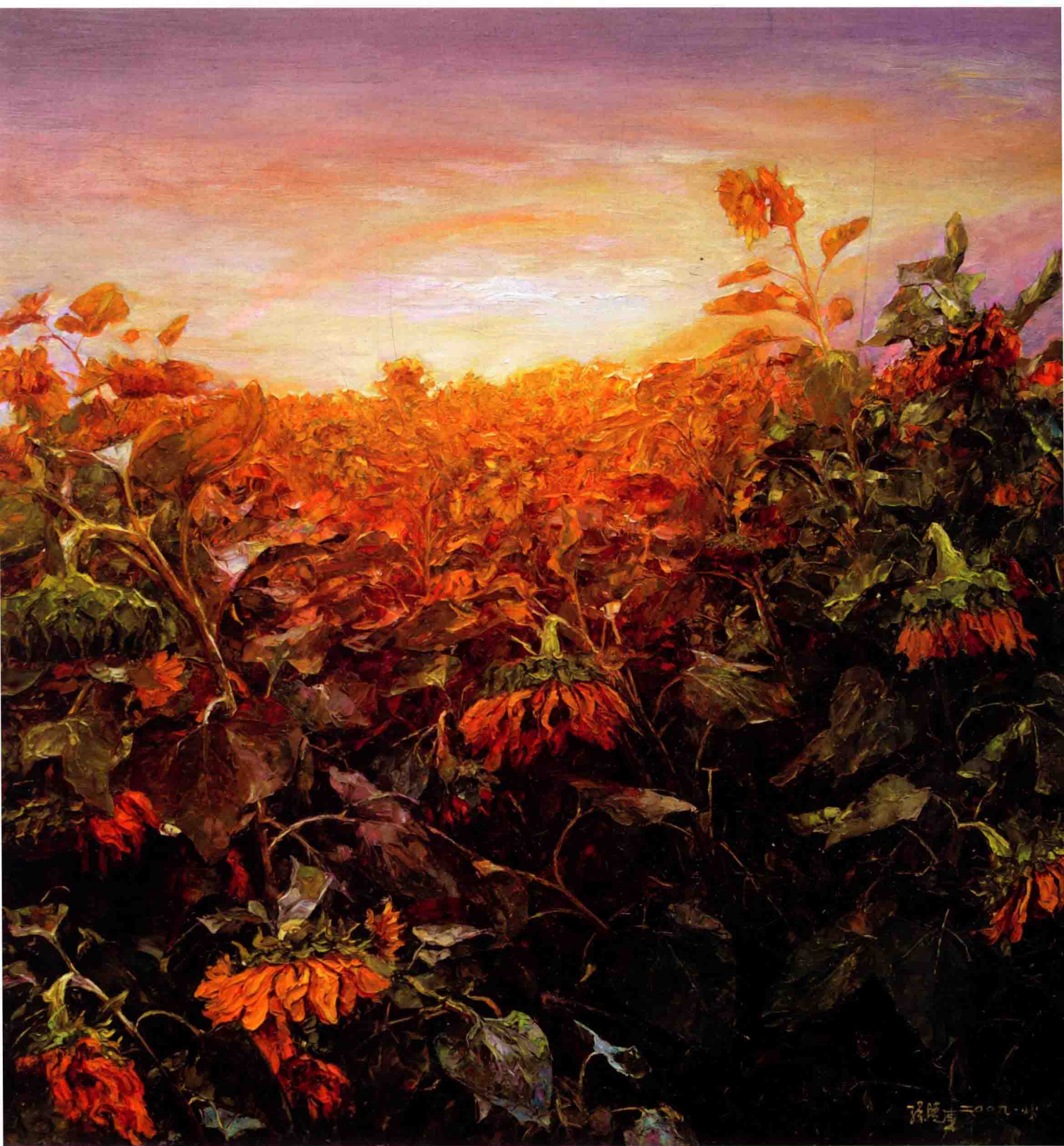
虹 120cm×120cm 2009年 亚麻布油彩