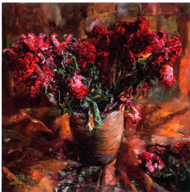
吉祥 80cm×80cm 2012年 亚麻布油彩