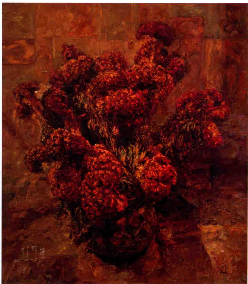
容颜 80cm X 70cm 2012年 亚麻布油彩