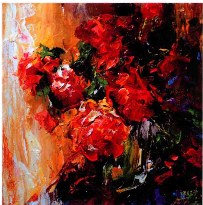
花卉系列之一 40cm×40cm 2012年 亚麻布丙烯