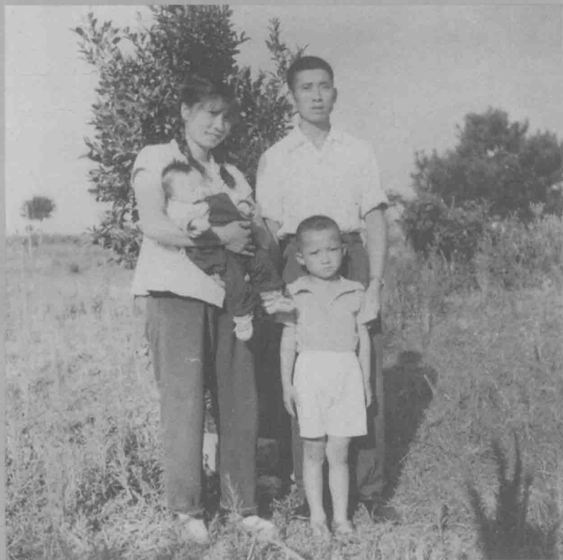
1971年全家福，摄于贵阳清镇飞机场