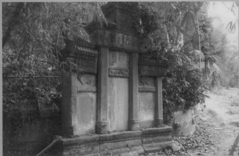
桐梓榜王氏族中祖坟（双坟）碑文，建立已有数百年，可供寻根问祖考证（2011年摄）