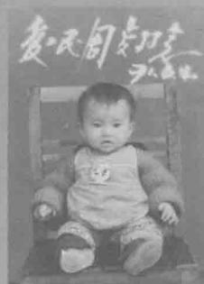
二女-光艳周岁 照片(1971年)