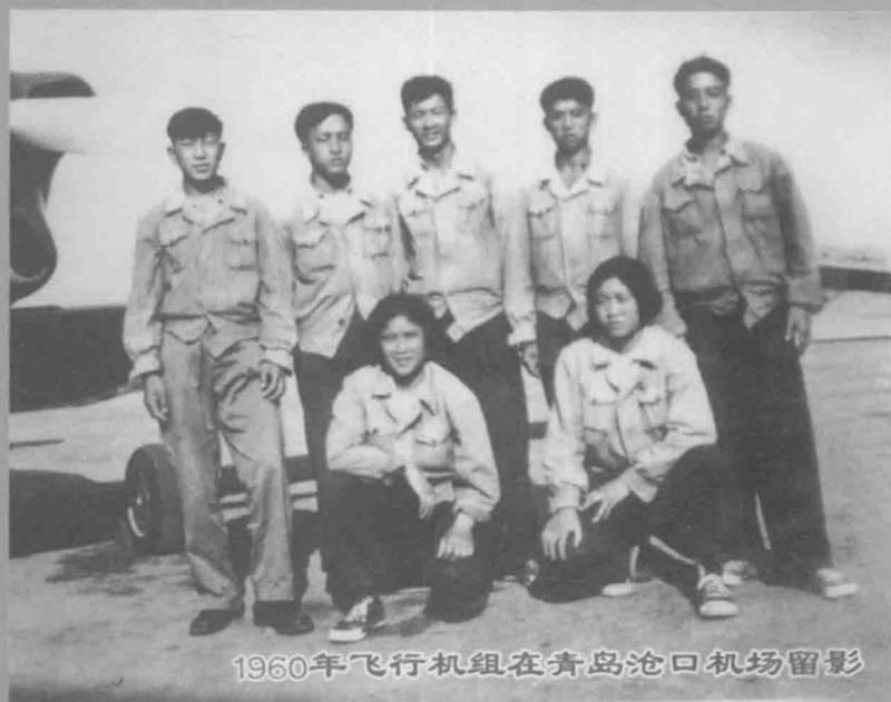
1960年飞行机组在青岛沧口机场留影