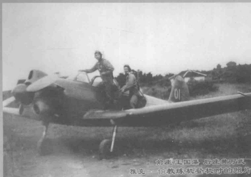
前座王国霖 后座黄万武 雅克—18教练机登机时的照片