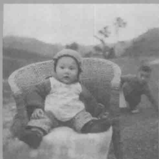
三子-光涛 10个月照片(1972年)