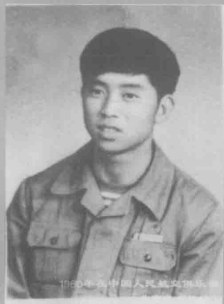
1960年为人民航空摄影