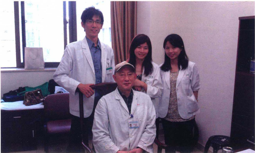
艾儒棣教授和他的学生