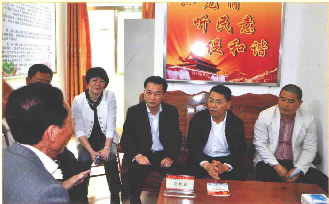
市委书记曹兴（右三），市委常委、组织部长黄真奕（右四）陪同中共湛江市委副书记、市长王中丙（右二）到党代表工作室调研。