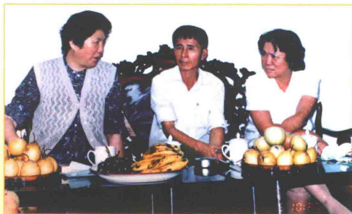
1991年10月，全国人大副委员长陈慕华（左）在广东省委副书记张帼英（右）陪同下视察林屋村。