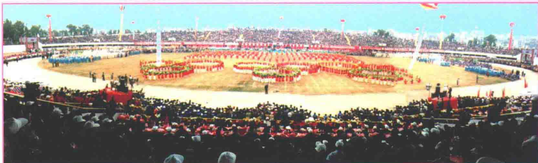
1995年2月，吴川撤县设市庆典大会场景之一。