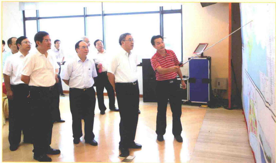
2013年8月11日，中共中央政治局委员、广东省委书记胡春华（右二），省委常委、常务副省长徐少华（前左一）在中共湛江市委书记刘小华（中）等的陪同下到吴川视察。图为中共吴川市委书记曹兴（右一）向各位领导介绍吴川情况。