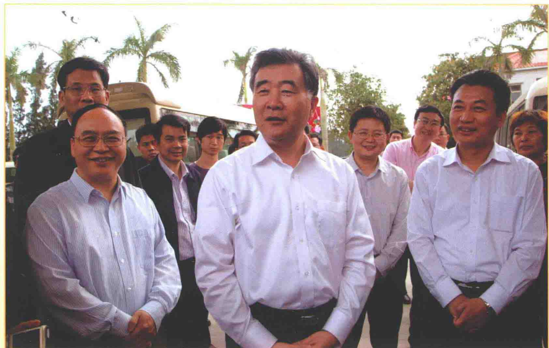
2012年3月31日，中共中央政治局委员、广东省委书记汪洋（中）来吴川市调研。湛江市委书记刘小华（左）、吴川市委书记曹兴（右）等陪同。