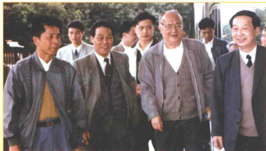
1996年1月9日，原全国政协副主席胡绳（前排右二）到吴川林屋机械厂视察。