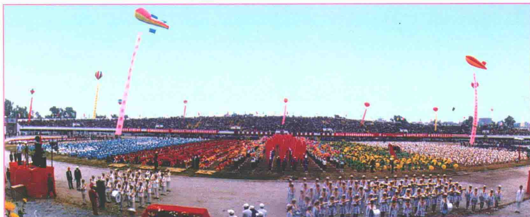
1995年2月，吴川撤县设市庆典大会场景之二。