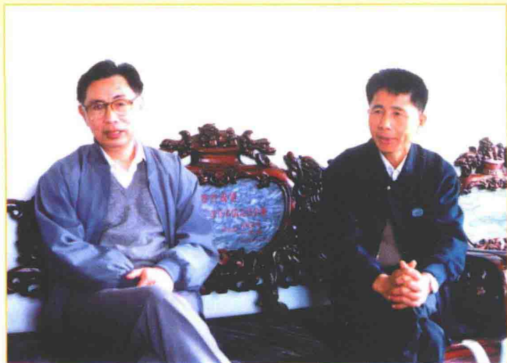
1991年12月，广东省省长朱森林（左）视察林屋村。