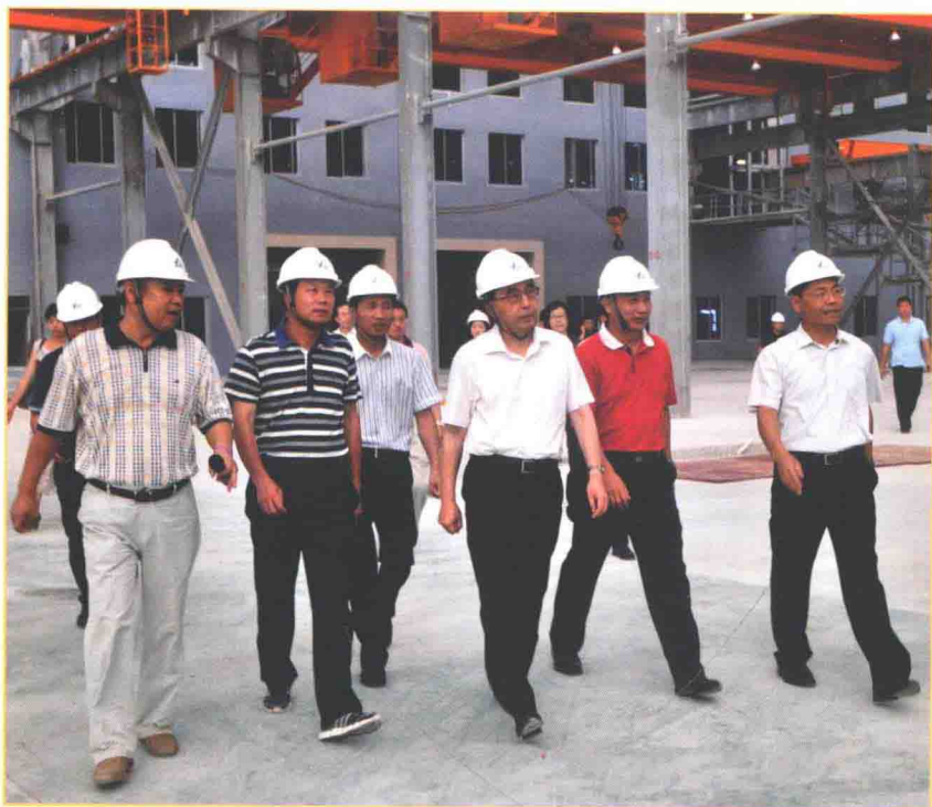
2013年7月11日，广东省省长朱小丹在广东威立海底特种电缆项目调研。