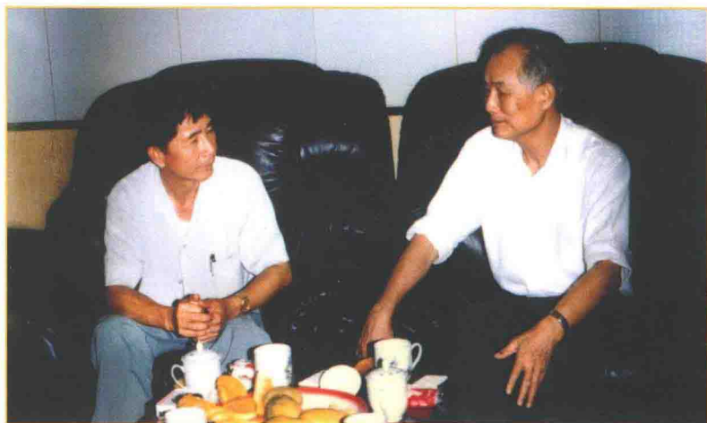
1985年5月，广东省委书记林若（右）到林屋村视察。