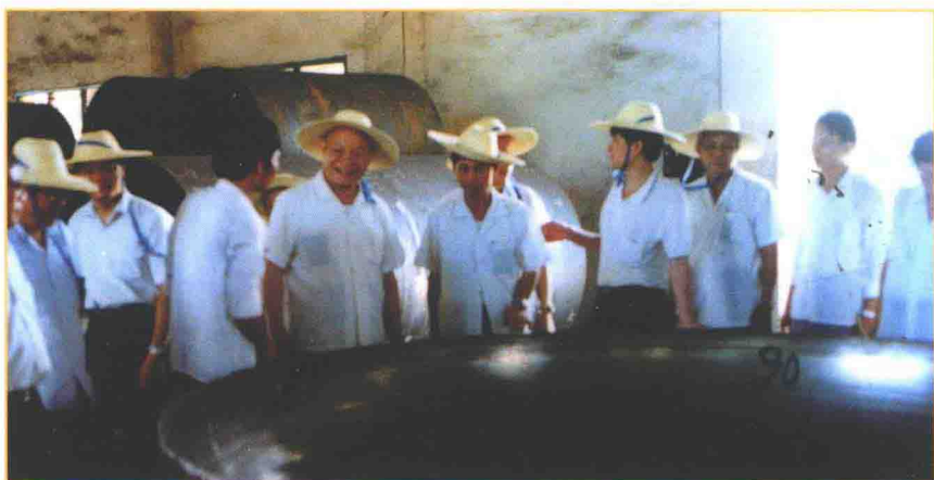
1992年8月，原广东省人大常委会主任罗天深入林屋机械厂车间视察。