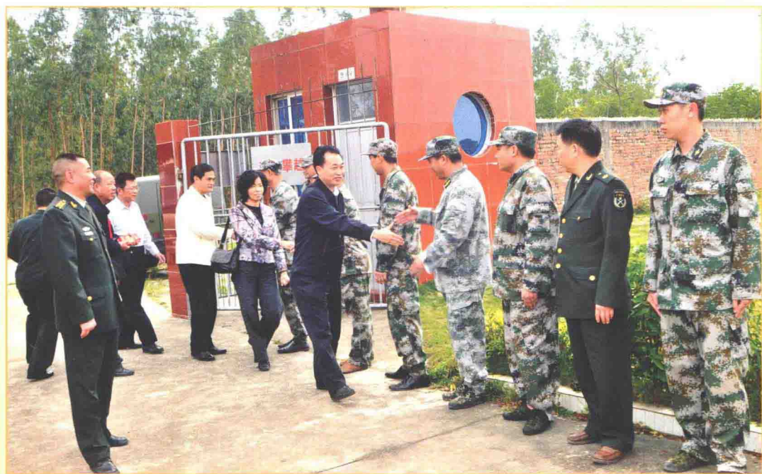
市委书记曹兴（右六）带领四套班子成员拥军慰问