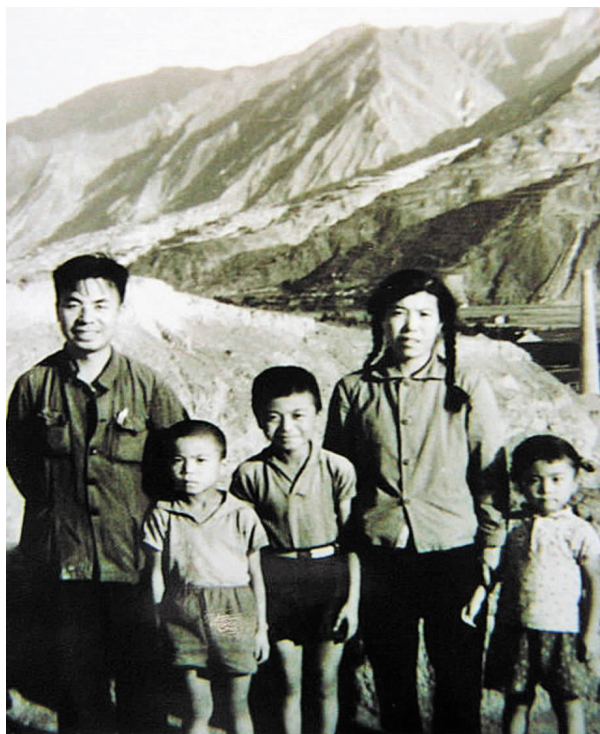
与妻子和三个年幼的孩子在东江