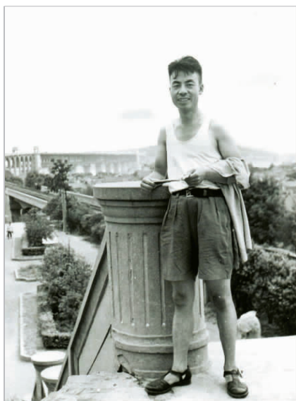
苏州学习时在武汉长江大桥