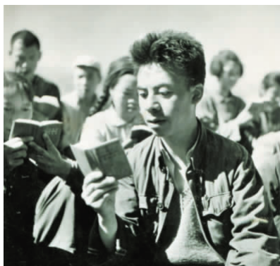
与社员一起学习《毛主席语录》