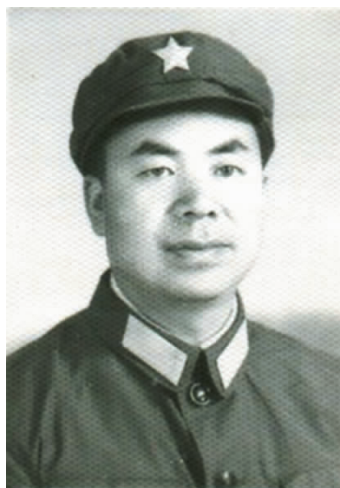
兼任民乐县武装部政委