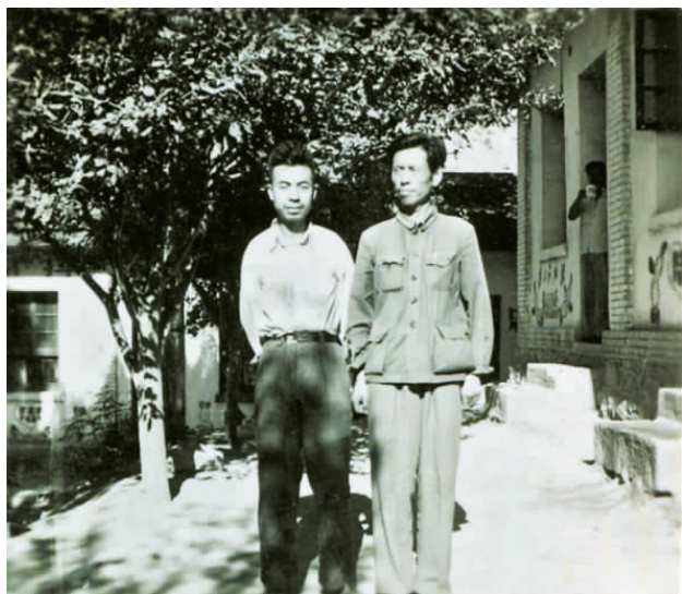
与农科所专家合影