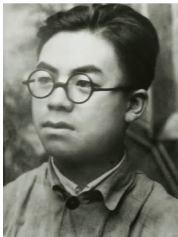
在武都地委组织部