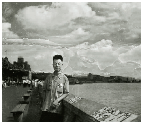
赴上海学习时在外滩