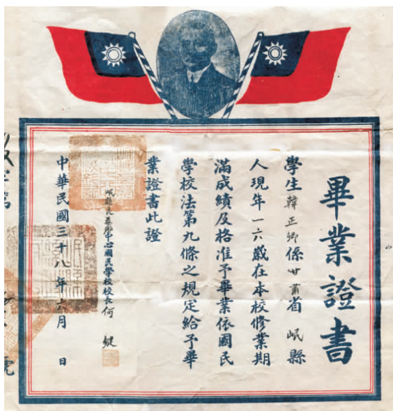
岷县良恭乡中心国民学校毕业证书