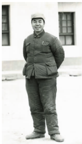
1972 年冬在民乐首次留影