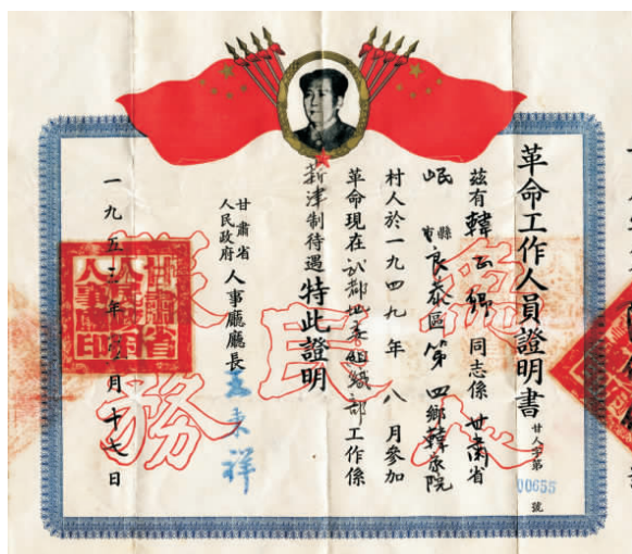
革命工作人员证明书