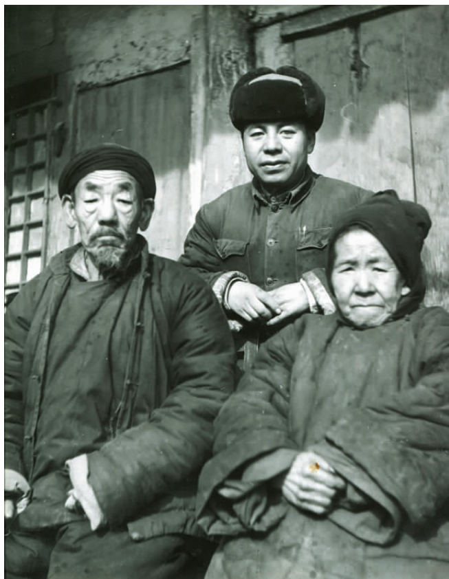
与父母留下的唯一合影