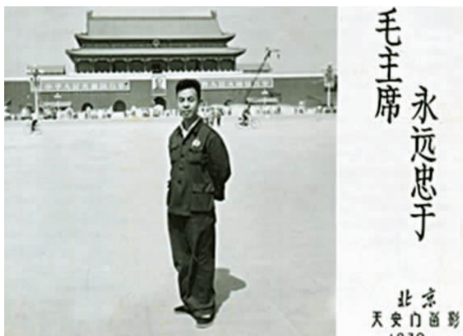
1970 年参加全国北方地区农业会议在天安门前