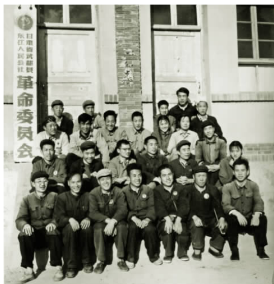
与东江公社革命委员会成员及部分青年团员合影