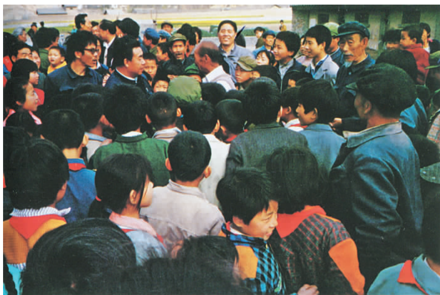
1992 年重返东江，乡亲们热烈欢迎