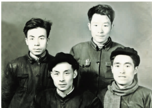
1965年调离省委组织部时与朋友合影