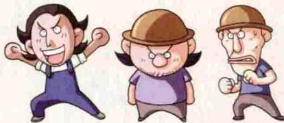
保罗 阿强 安迪