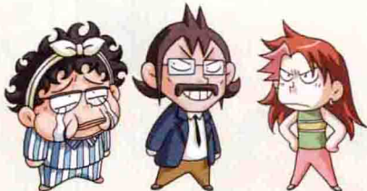
知本教授 安德鲁教授 罗拉