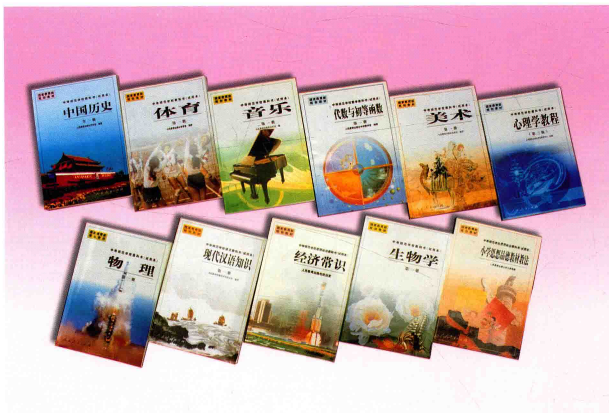
被列为“国家教育部规划教材”的中等师范学校教科书