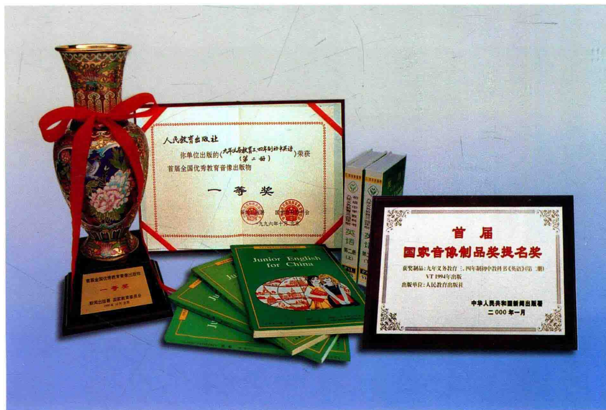
获国家级奖的九年义务教育系列化教材