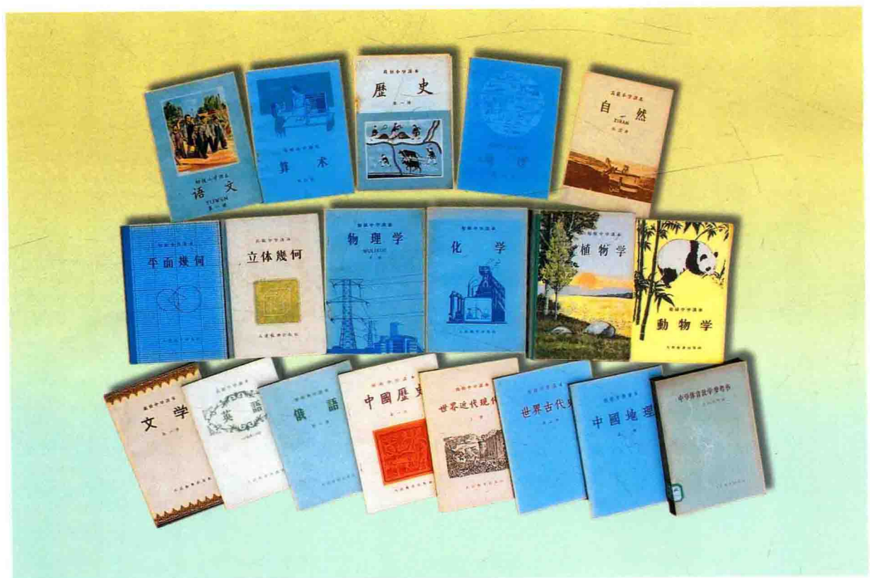
1954年出版的中小学教材