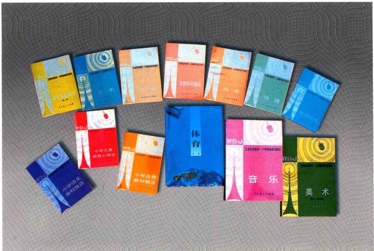
1986年出版的卫星电视教育教师培训教材