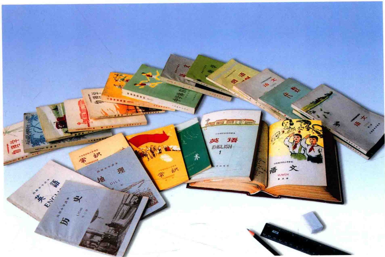
1961年出版的十年制中小学教材