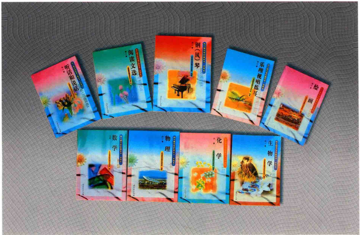
1998年出版的幼儿师范学校教科书