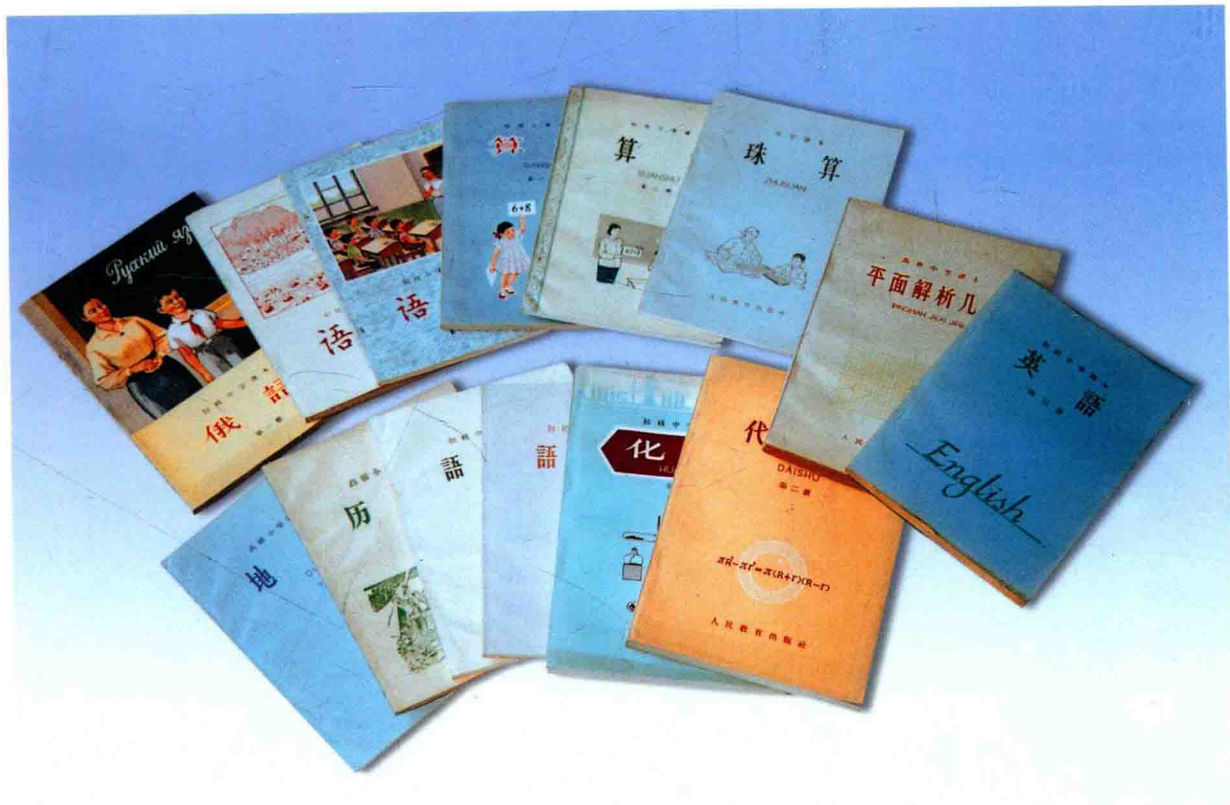
1963年出版的十二年制中小学教材