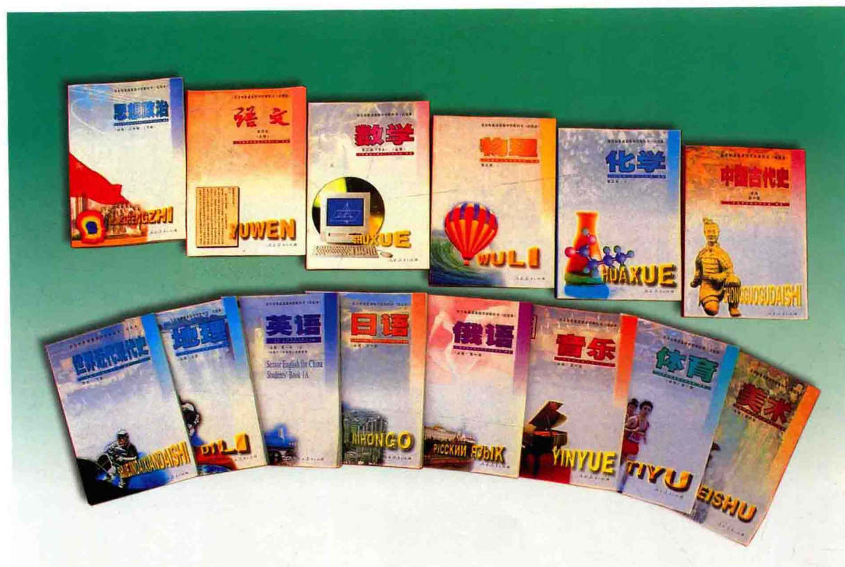
1997年出版的全日制普通高级中学教科书（试验本）