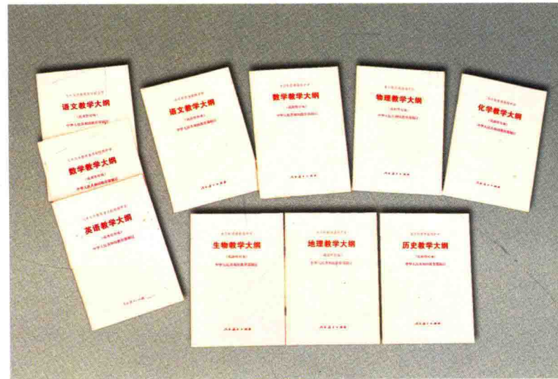
新中国成立以来受教育部委托主持参与草拟、制订的部分中小学教学大纲