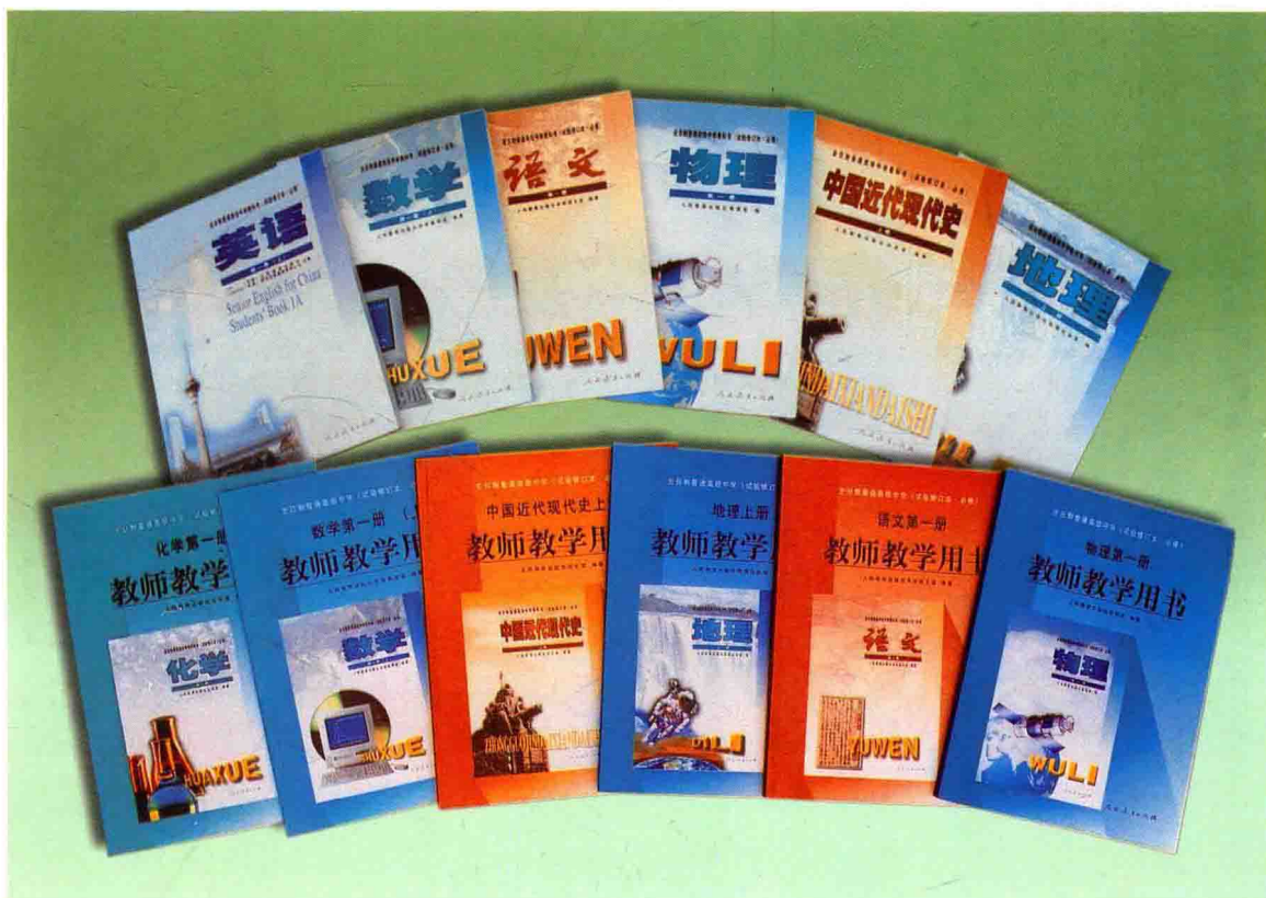
最新版全日制普通高级中学教科书(试验修订本)