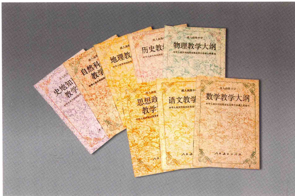
成人高级中学教学大纲