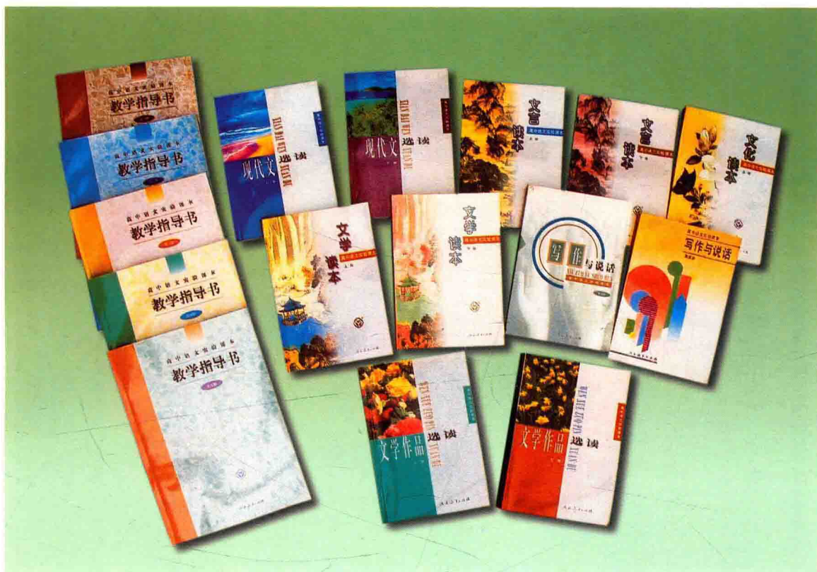
高中语文实验课本(1996 ~ 1999 年版)