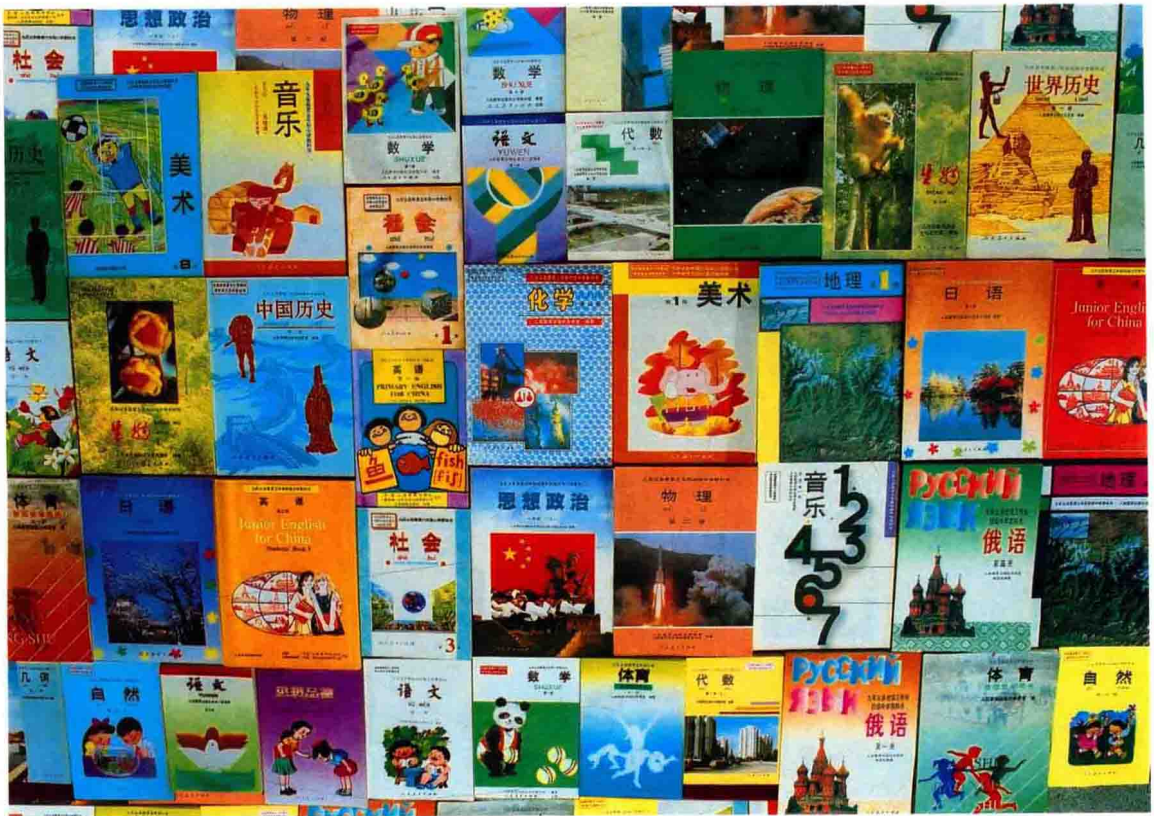
1992年出版的九年义务教育中小学教科书