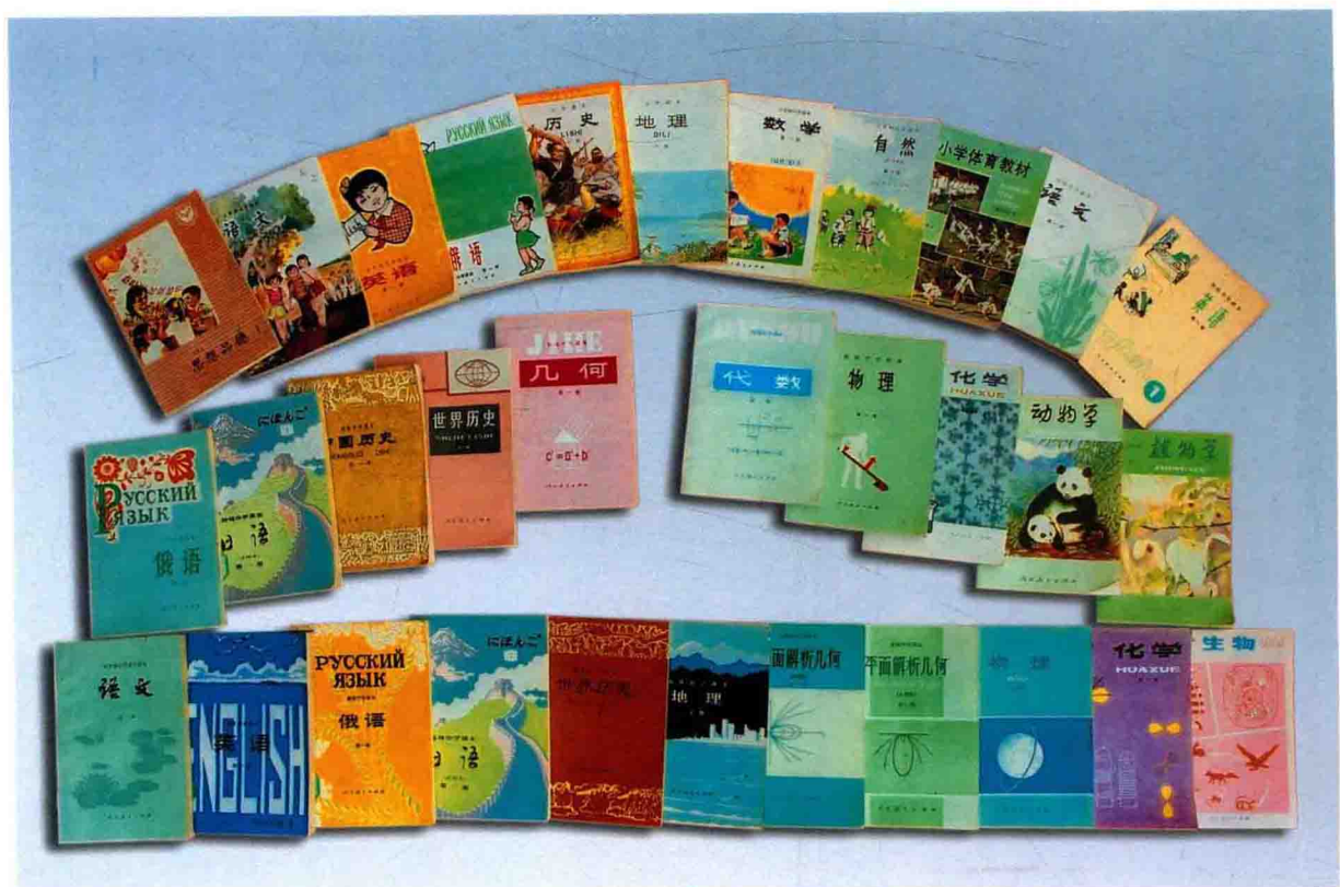
1988年修订出版的中小学各科教材