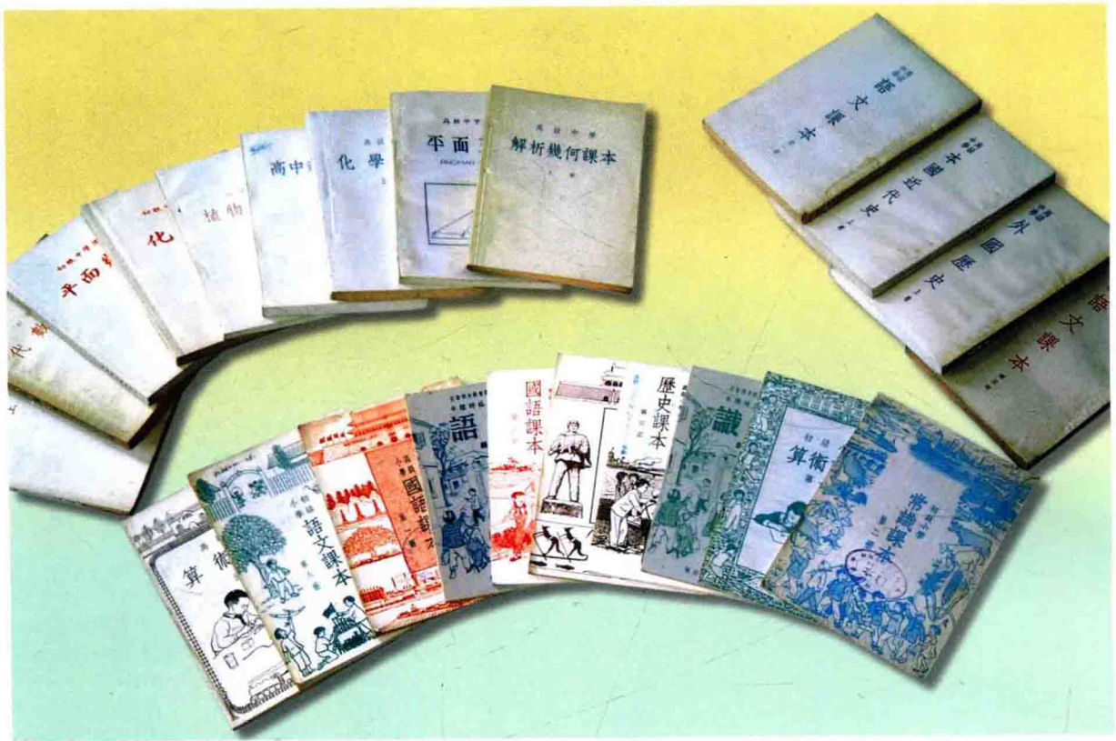
建国初期修订的新中国第一套教材