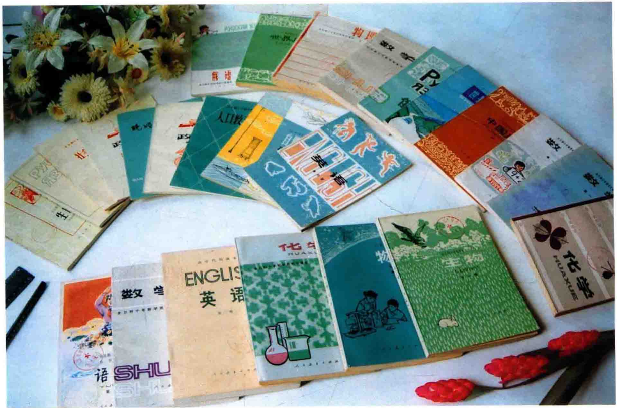
1977年出版的“文革”后第一套统编教材