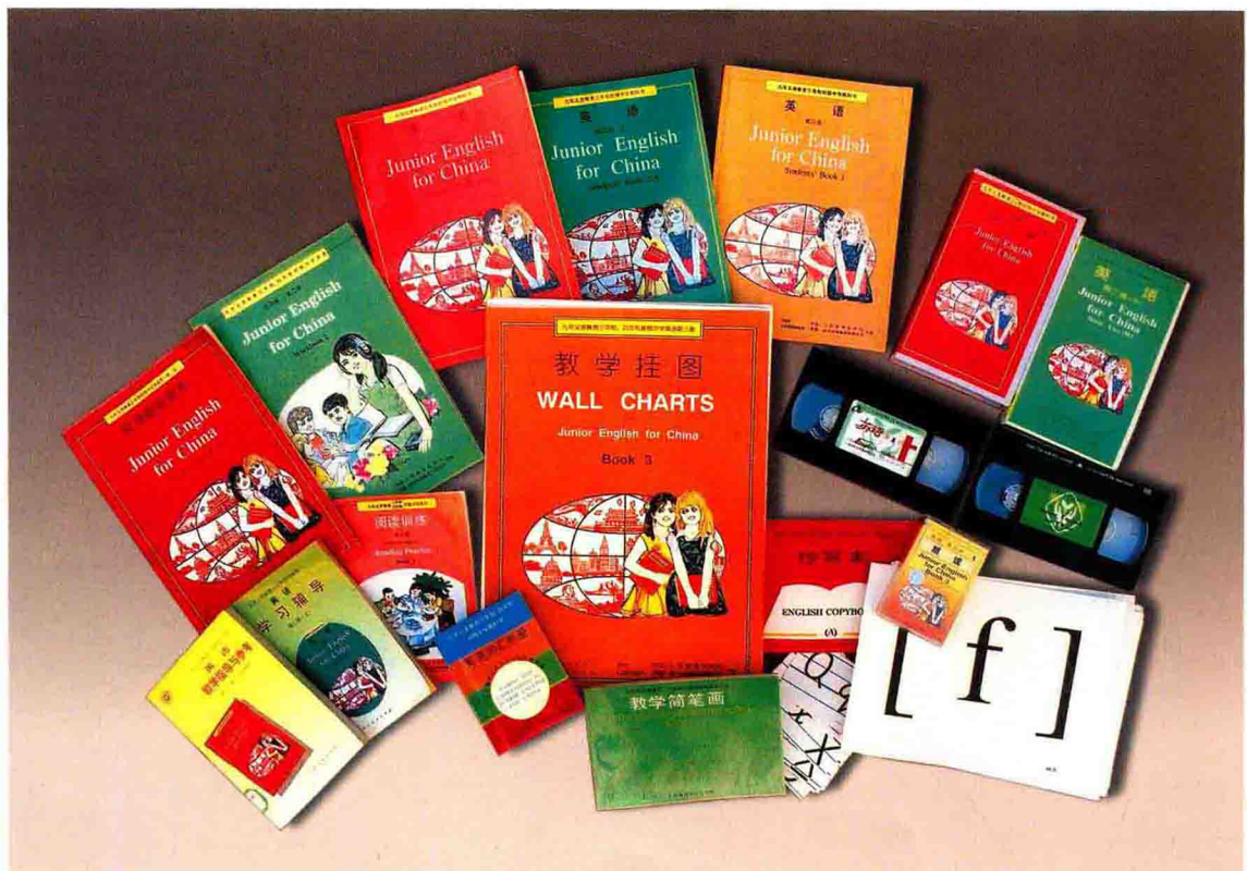
1992年出版的九年义务教育英语系列化教材