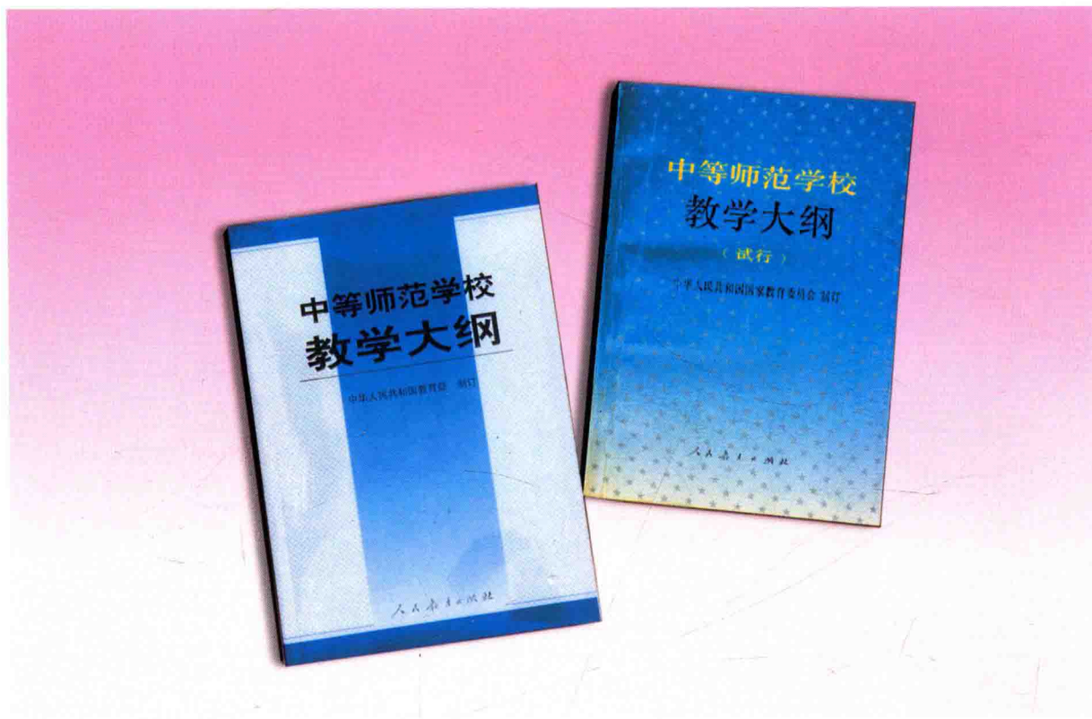
中等师范学校教学大纲