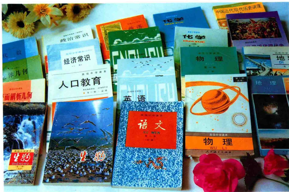
1990年出版的高级中学课本