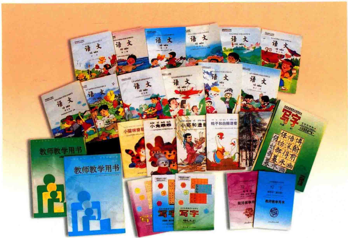
1992年出版的九年义务教育六年制小学语文系列化教材