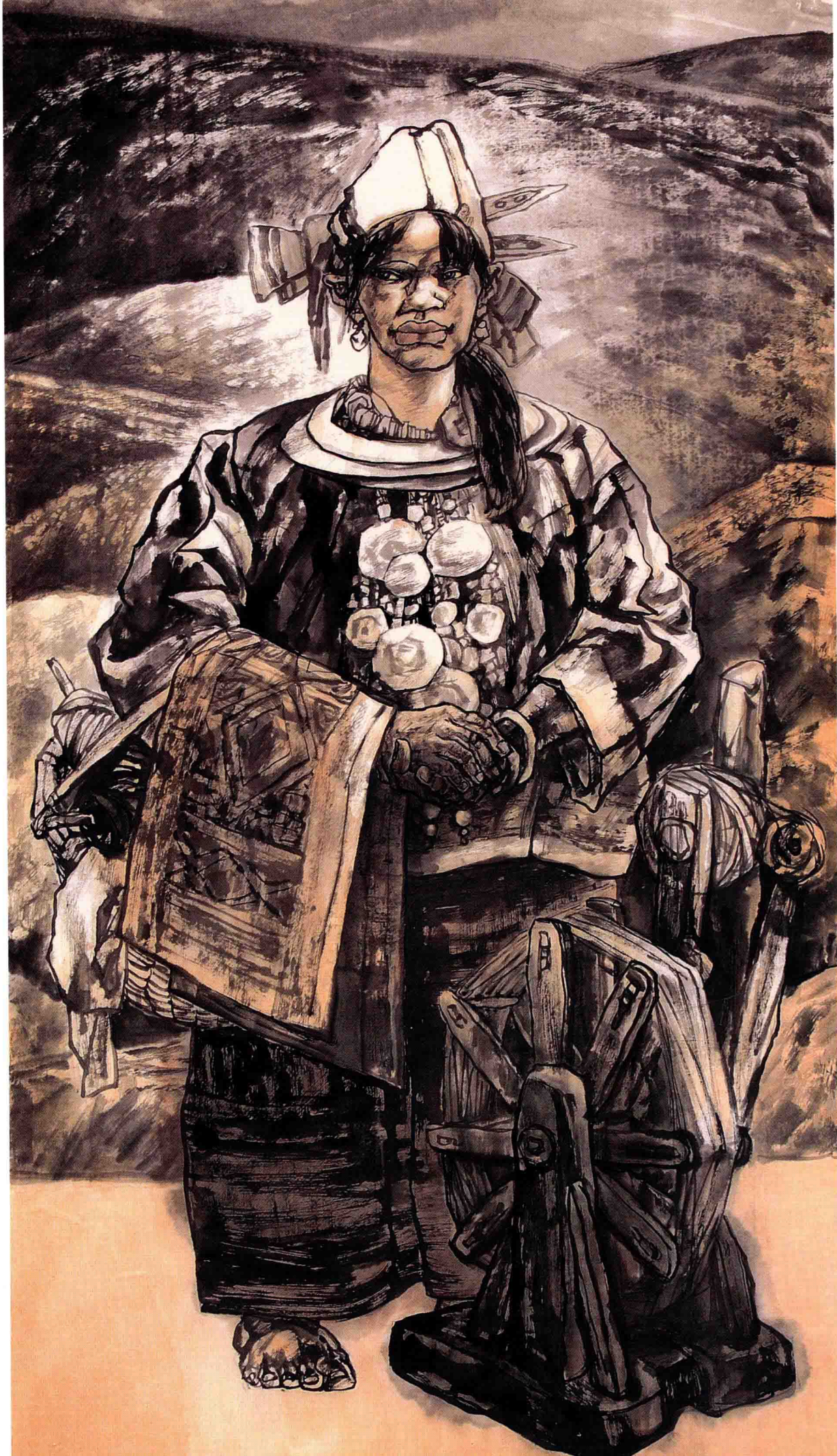
© 黎山印记之一 2008年 纸本 212cm x 98cm