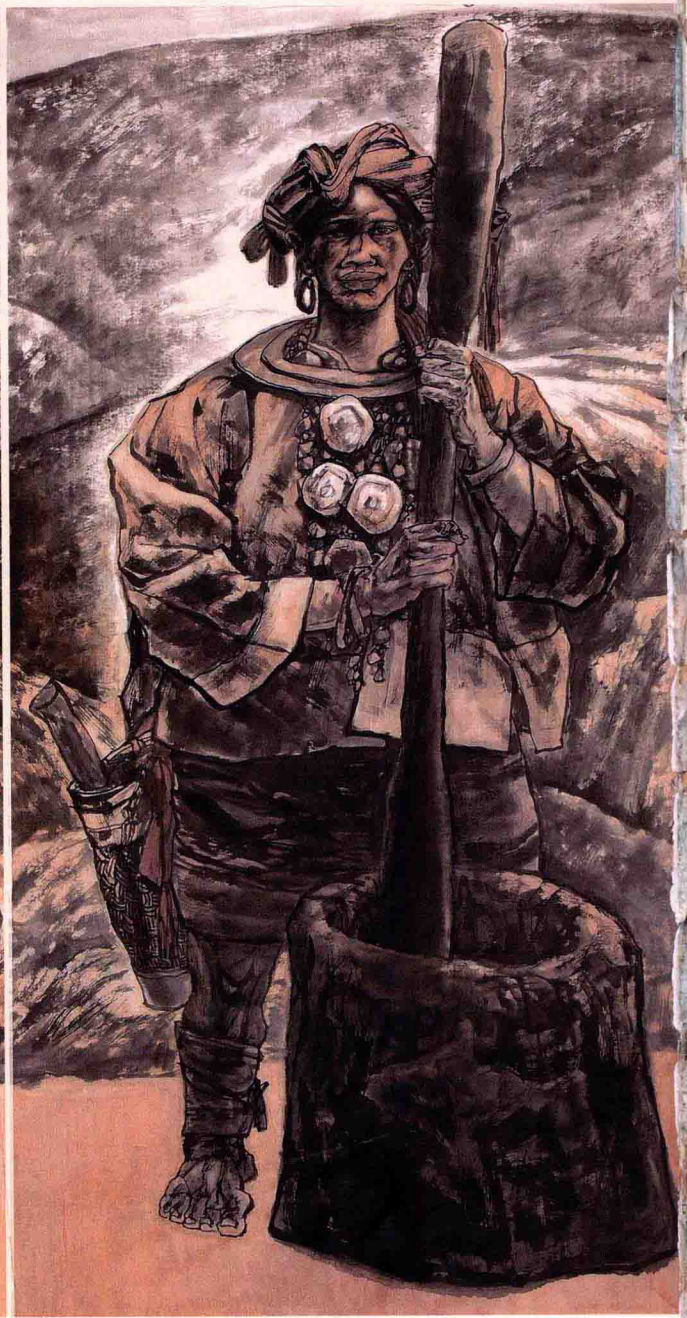
© 黎山印记 2008年 纸本 212cm × 392cm