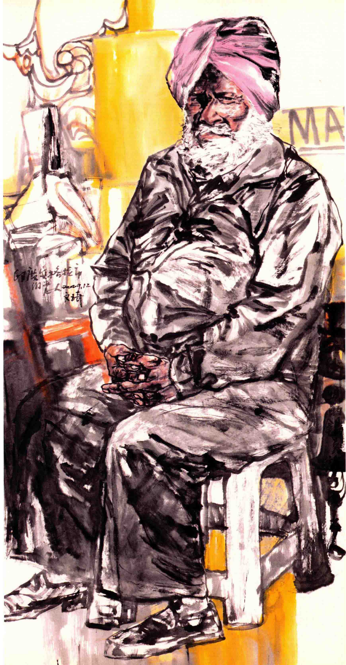
© 印度写生 2009年 纸本 136cm × 68cm