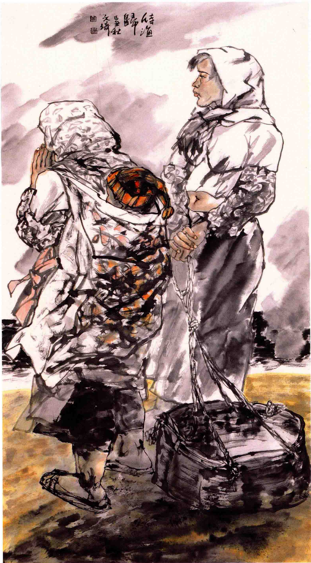
© 待渔归 2009年 纸本 136cm × 68cm