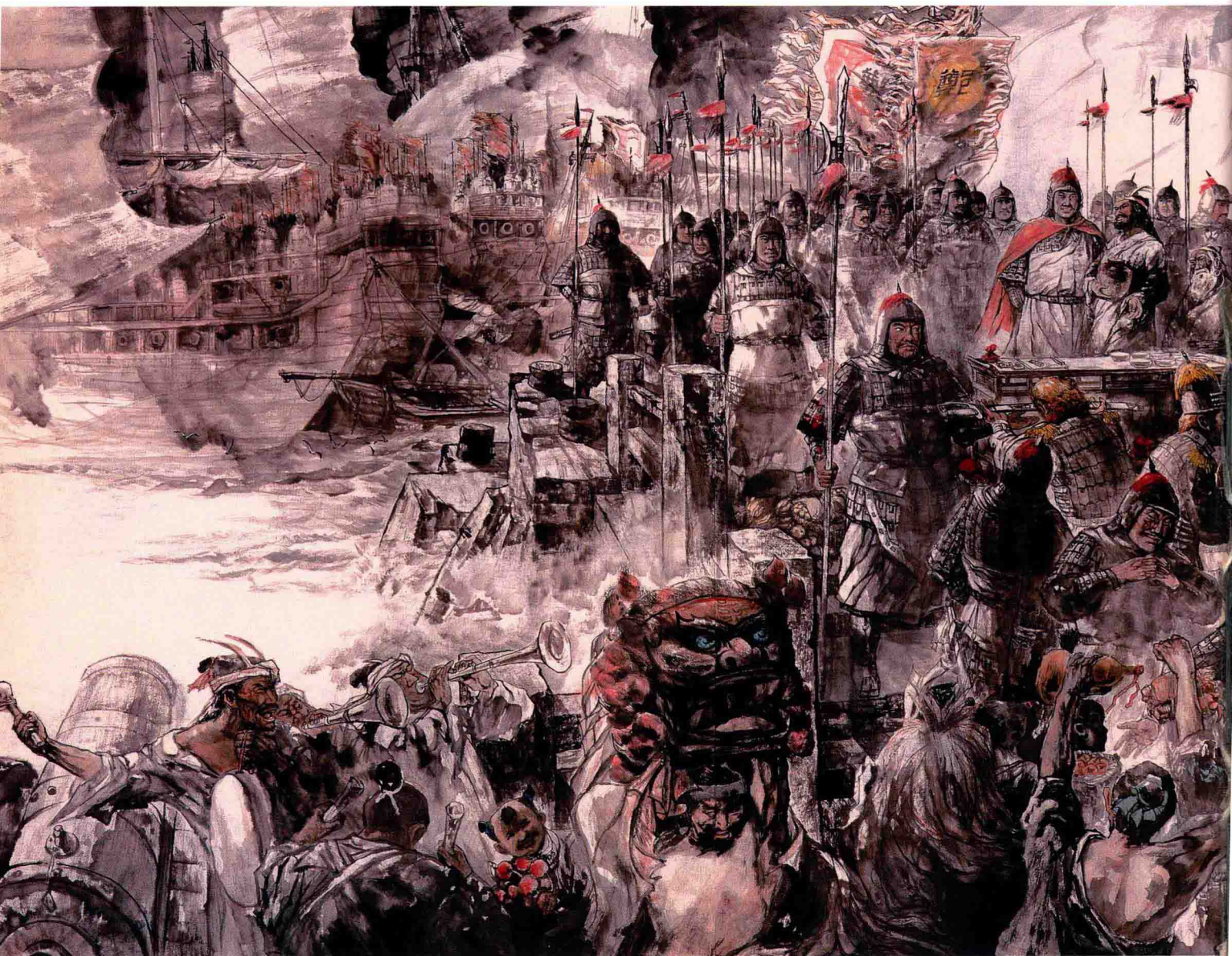
© 郑成功收复台湾 2003年 纸本 190cm × 500cm