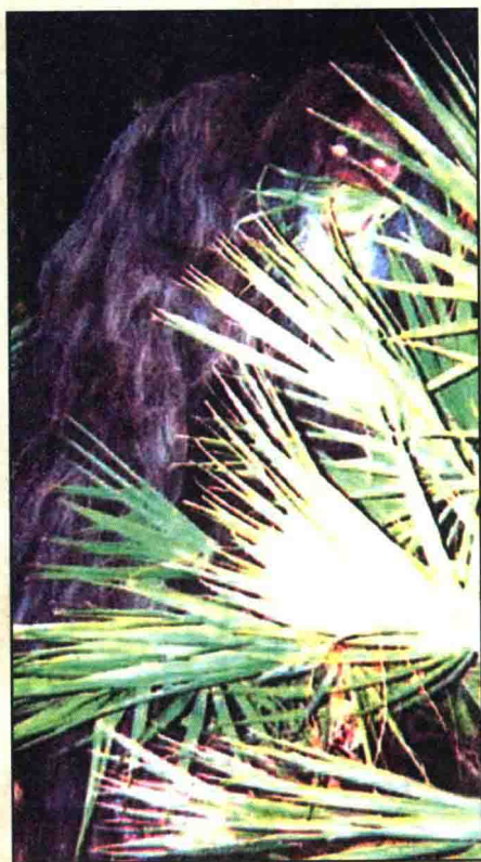
据说，这张照片就是佛罗里达州臭鼬猿。