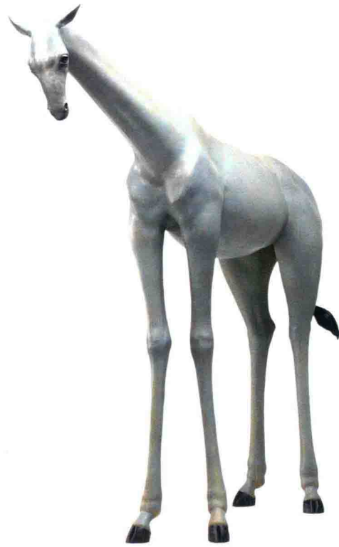
异境 —— 不损兽 Otherworld - Invulnerable beast