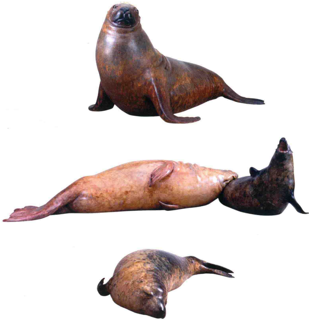
异境——唯岸是处 Otherworld - Only on the bank do we rest