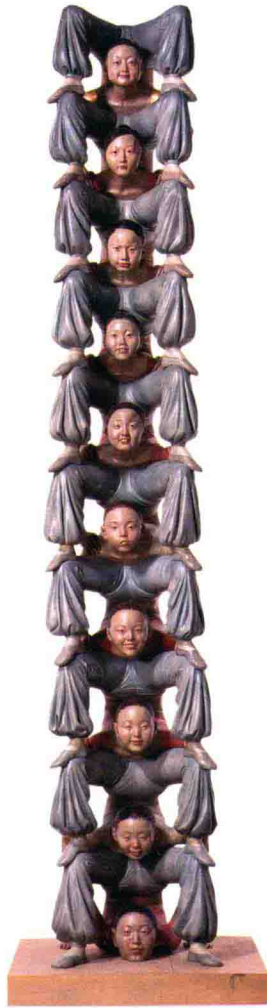
凡人 —— 无限柱 Mortals - Endless tower