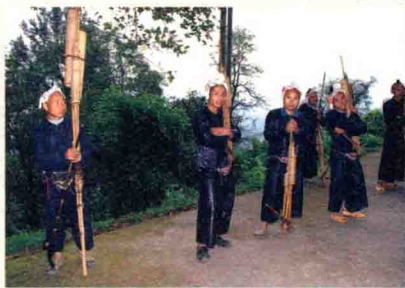
苗族中部方言芦笙

东部方言苗族古歌《战争迁徙·涉水爬山》唱道：“齐了九面牛皮大鼓……齐了三百芦笙……礼乐齐奏，笙歌浩荡……笙歌响出了九十九天路长，笙歌震荡三山五岳。”这当是对“放驩兜于崇山以变南蛮”这部分“三苗”后裔被驱赶到“五溪”一带后，聚集祭祖的盛大场面的记忆。西部方言苗族逃迁到黔西北时，首领爷觉黎力召集族众祭祖时庄严宣布：“让卯嘎直兄弟保留古歌头，由我儿孙保留古歌尾；