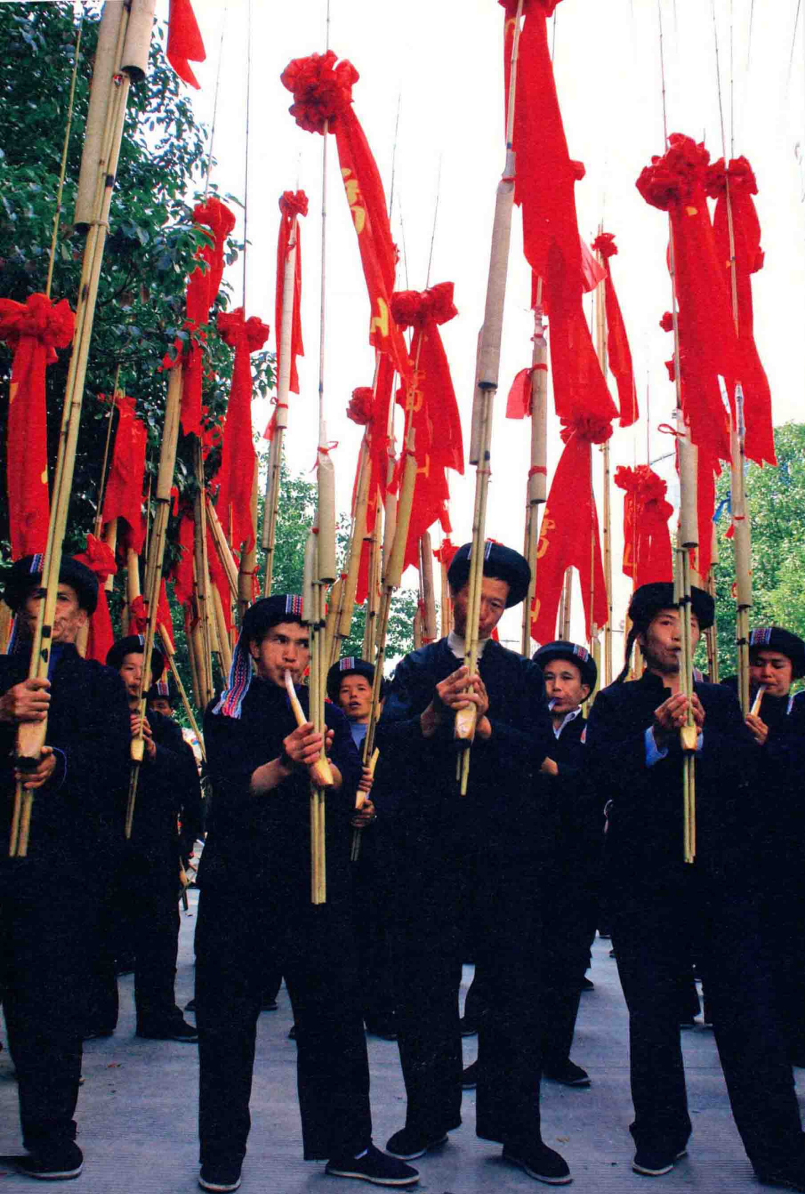
■ 高排芦笙