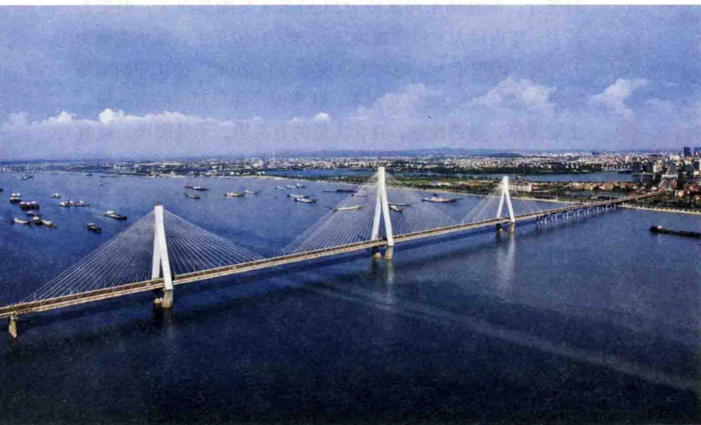
洞庭湖大桥