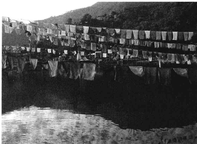
莲师出生地陀那果夏湖

行登上小岛，稍事休息后，国王将众侍从留在岛上，自己与老舵公驾一叶小舟离岛出行。一段行程后，一座黄色的大山渐入眼帘，舵公说：“前面是座金