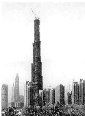
图 00-05 阿联酋 - 布尔吉迪拜大厦