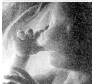
图 00-09 子宫中的胎儿