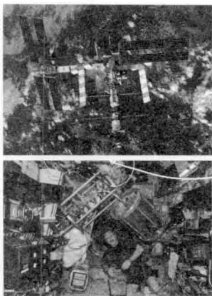
图 00-06 国际空间站 9