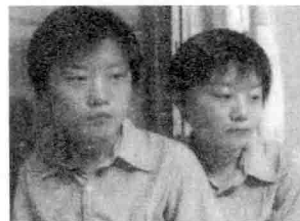
图 00-10 四川双胞胎姐妹 12