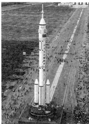
图 00-07 神舟七号, 2008 年