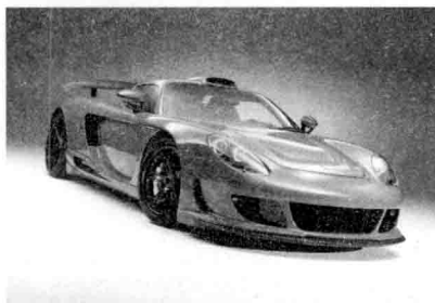
图 00-03 量产车保时捷 GT，时速 330 公里，百公里加速仅需 3.6 秒（2006 年产品）。品牌创始人费迪南·保（Ferdinand Porsche 1875-1952）