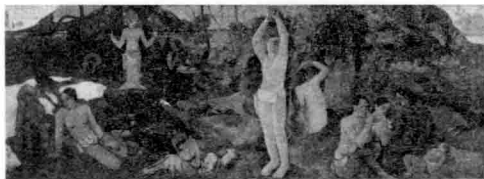
图 00-01 《我们从哪里来？我们是谁？我们往哪里去？》 保罗·高更，1897

中国的先哲屈原在更早的二千多年前就向天发问：“遂古之初，谁传道之”——是谁传下了远古开端的事情？“上下未形何由考之” 2 ——他根据什么办法考察的呢？“路漫漫其修远兮，吾将上下而求索。”屈原提出了一系列的设计问题：地是如