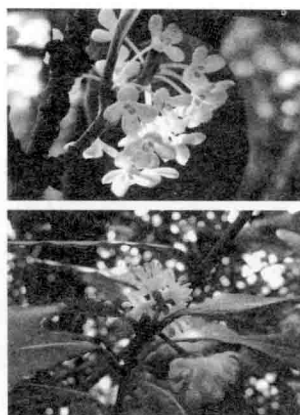
图 00-08 上图为桂花 10 , 下图为月桂, 2007 年拍摄