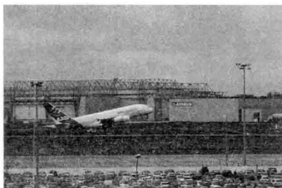
图 00-02 波音 747 飞机

科技在今天飞速发展。能够体现人类设计最尖端技术水平的为航天设计，日常生活中我们可以享受到的设计是飞机 3 。速度是人的本能追求。人类之初，所表达的具象图形之一就是“飞鸟”和“游鱼”，人们用“白驹过隙”形容时间飞逝，汉代的“马踏飞燕”就是人类精神的一种超迈象征，在今天成为“中国旅游”的标志图形。超音速客机 20 世纪 60 年代末就已经问世，如二倍音速的载客协和飞机（Concorde） 4 ，成为人类在大气圈内发展的一个起飞平台。协和飞机退役进入世界各大博物馆，实际上是在隆重纪念人类创造的自由，向往更快的速度和更高的高度。成为时代新标志的是 2007 年试飞成功的“A380 空中客车” 5 ，号称亚音速每小时约 902 公里，载员达 850 人。使续航能力达 15000 公里，比协和飞机飞得更远。亚音速的“波音 747” 6 （图 00-02）早已是民航的日常飞行机种，以 0.85 马赫的速度在 2 万米高度内的空中来回穿梭。载员 416 人续航更大达 13570 公里。飞机的设计以浮力推进定向重心平衡技术为基础。