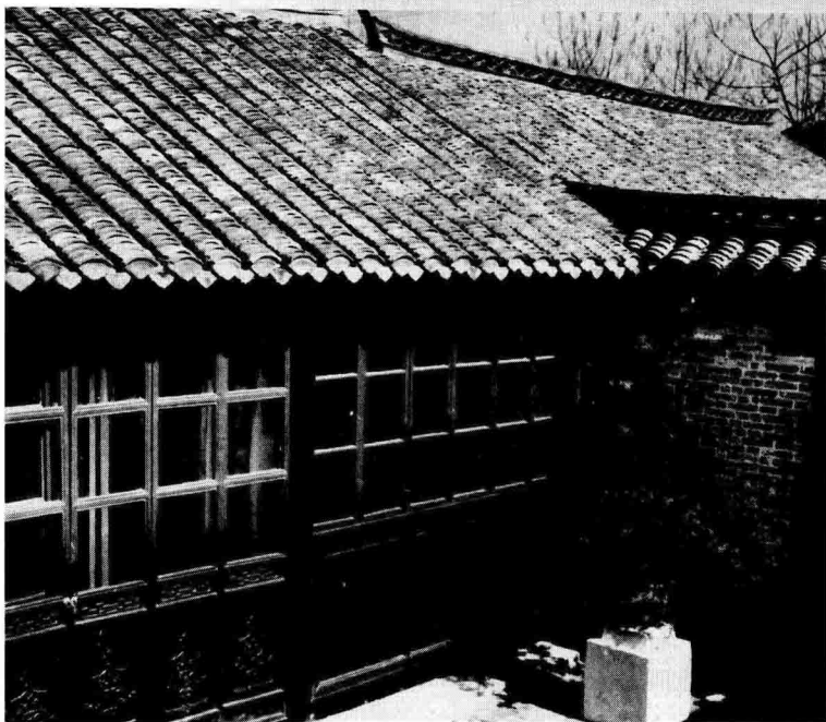
■ 江苏淮安驸马巷周恩来故居

全理解其中的含义，但已是背得烂熟。待恩来稍长，陈氏就经常给他讲一些故事，如《窦娥冤》、《韩信胯下受辱》、《岳飞传》和太平天国、义和团等。讲得最多的是巾帼女杰梁红玉、秋瑾的故事，这使得恩来幼小的心灵受到熏陶。在读书听故事之余，恩来还坚持写字，无论酷暑，还是寒冬，从不间断，一丝不苟，非常认真，终于练得一手魏碑加颜体的好书法。现在，当人们站在天安门广场人民英雄纪念碑前，抬眼望去，那雄浑有力的碑文，不禁使人想起周恩来少年时勤学苦练的情景。