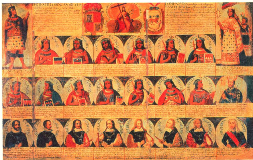
▲ 这幅 18 世纪的画作呈现了从曼科·卡帕克到西班牙国王费尔南多六世历代印卡统治者的形象。

集，定名《印卡人：王家纪事》。马德里的王家会议对书名不满意，将其改为《秘鲁通史》。