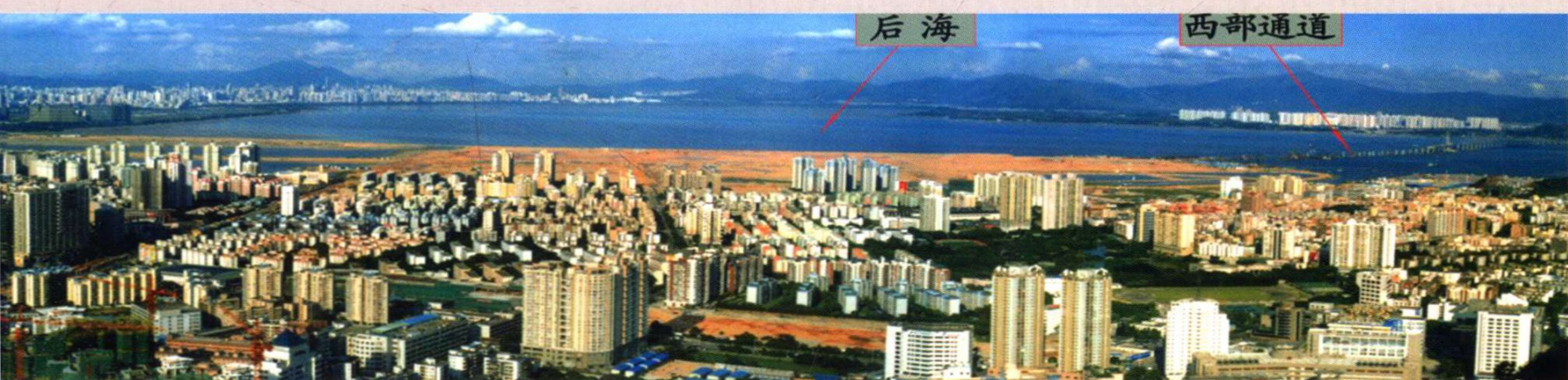
2005年从大南山鸟瞰南头半岛