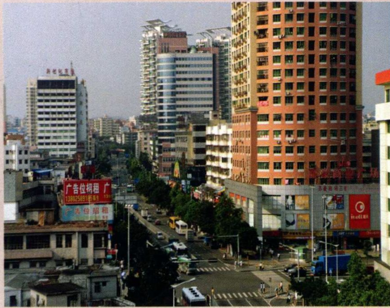
2005年南新路