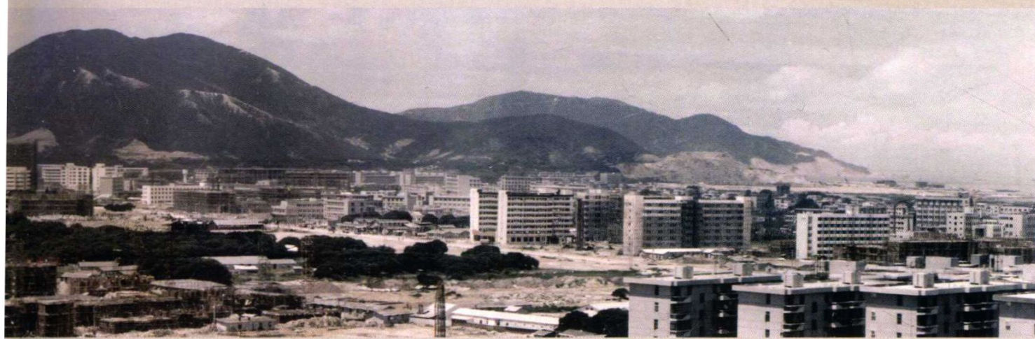
1984年南山学府路片区