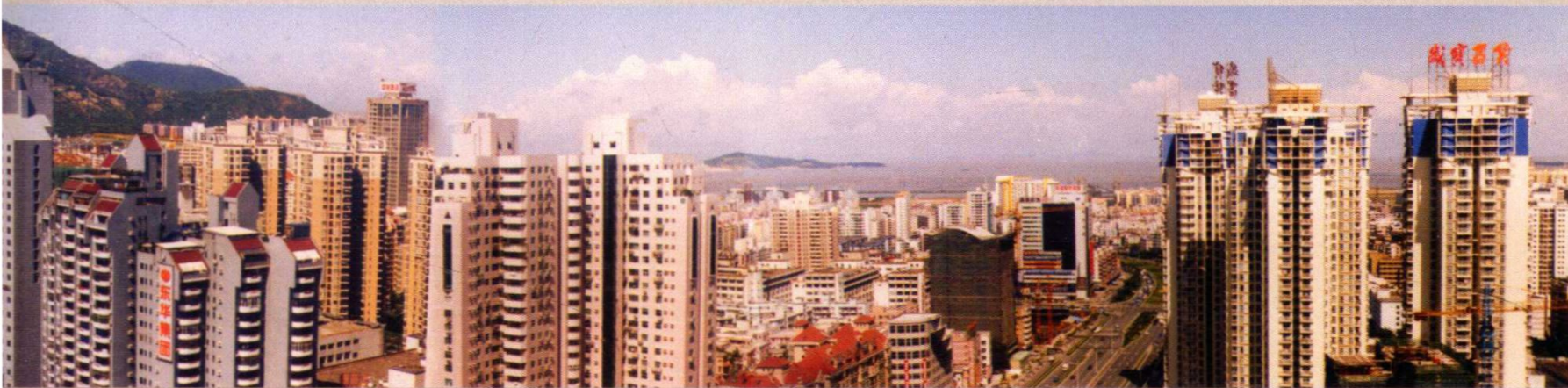
2003年南山商业文化中心区