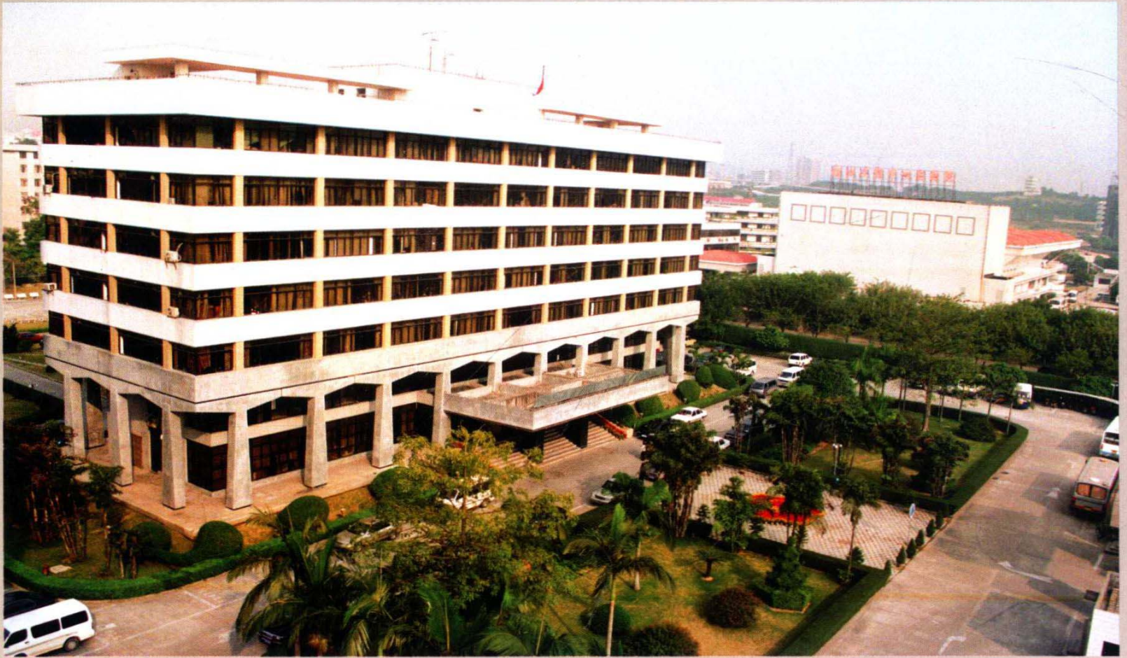
1998年2月前，南山区委区政府办公楼