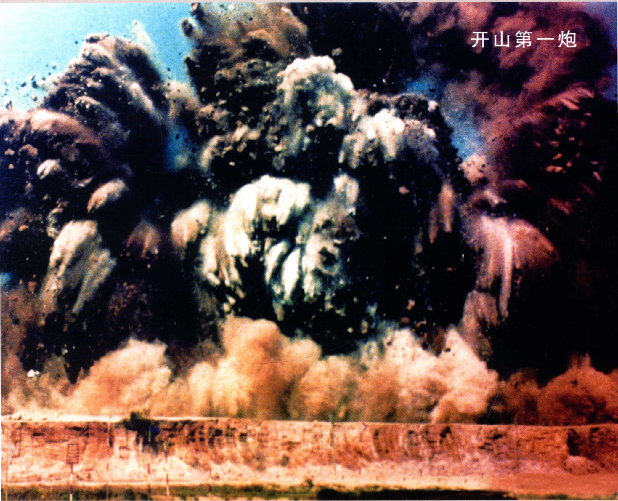
1979年7月南头半岛开发蛇口工业区的第一声炮响，揭开中国改革开放的序幕