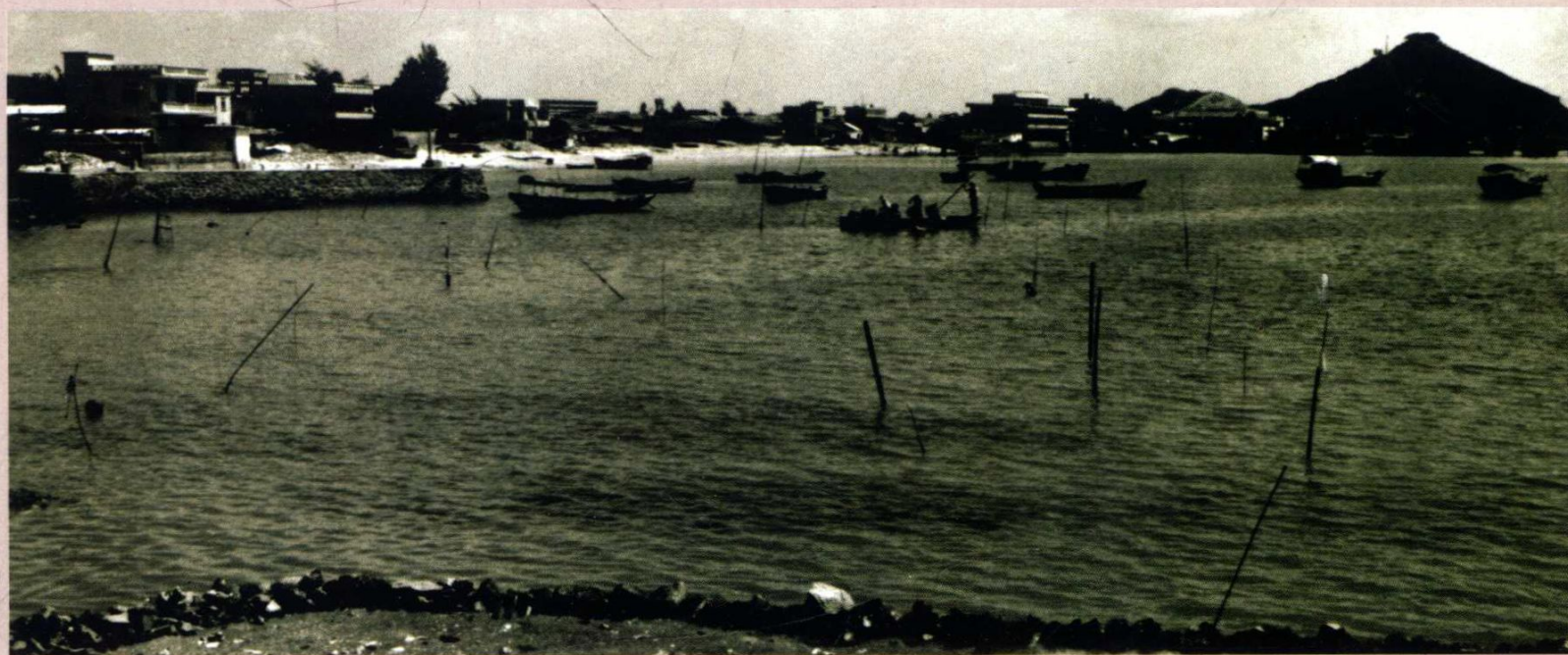
1984年蛇口避风塘