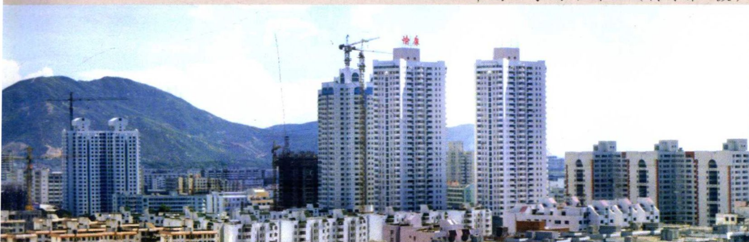
2003年南山学府路片区