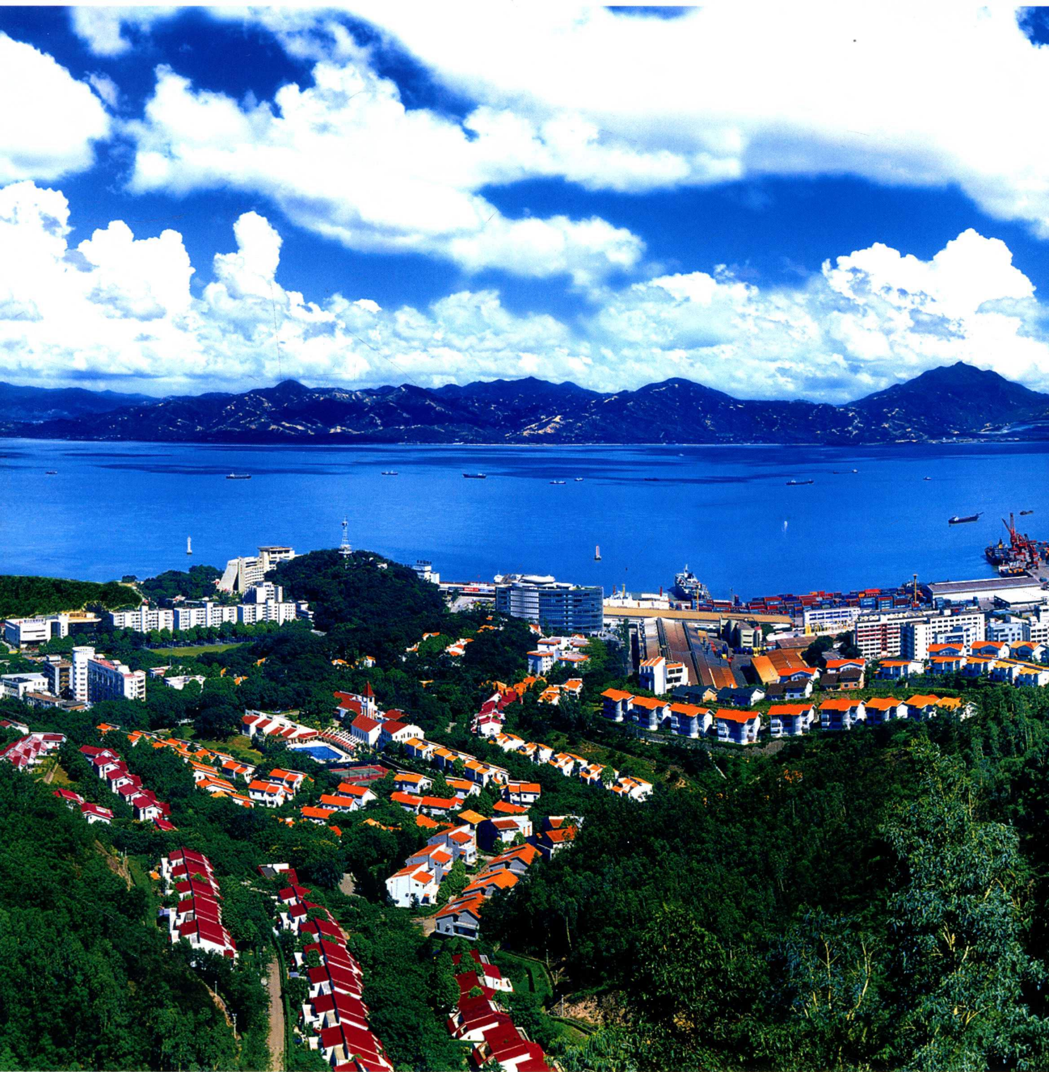
2003年蛇口片区