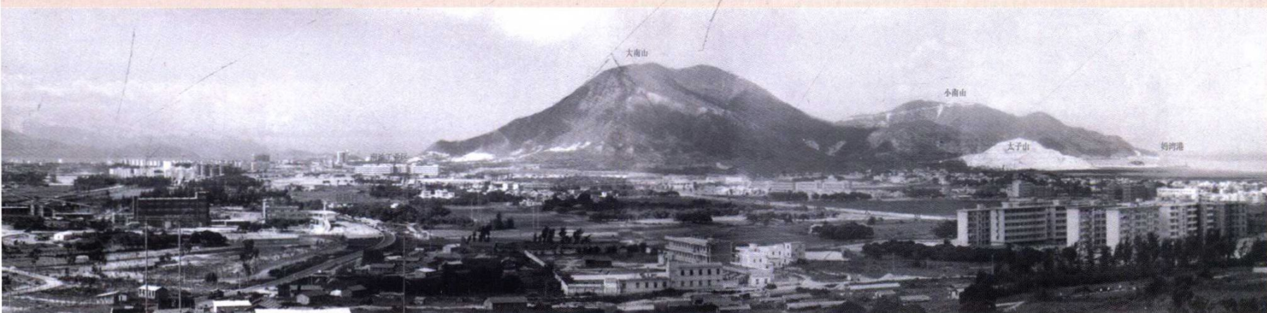
1984年深圳科技工业园