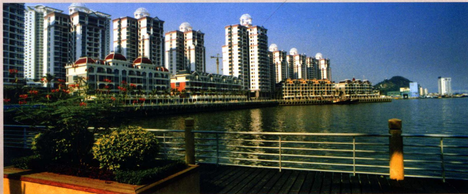
2005年蛇口渔港