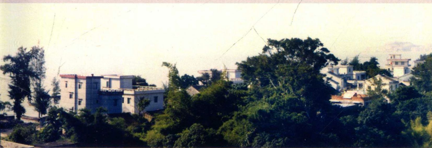
1984年深圳湾畔的南山后海片区