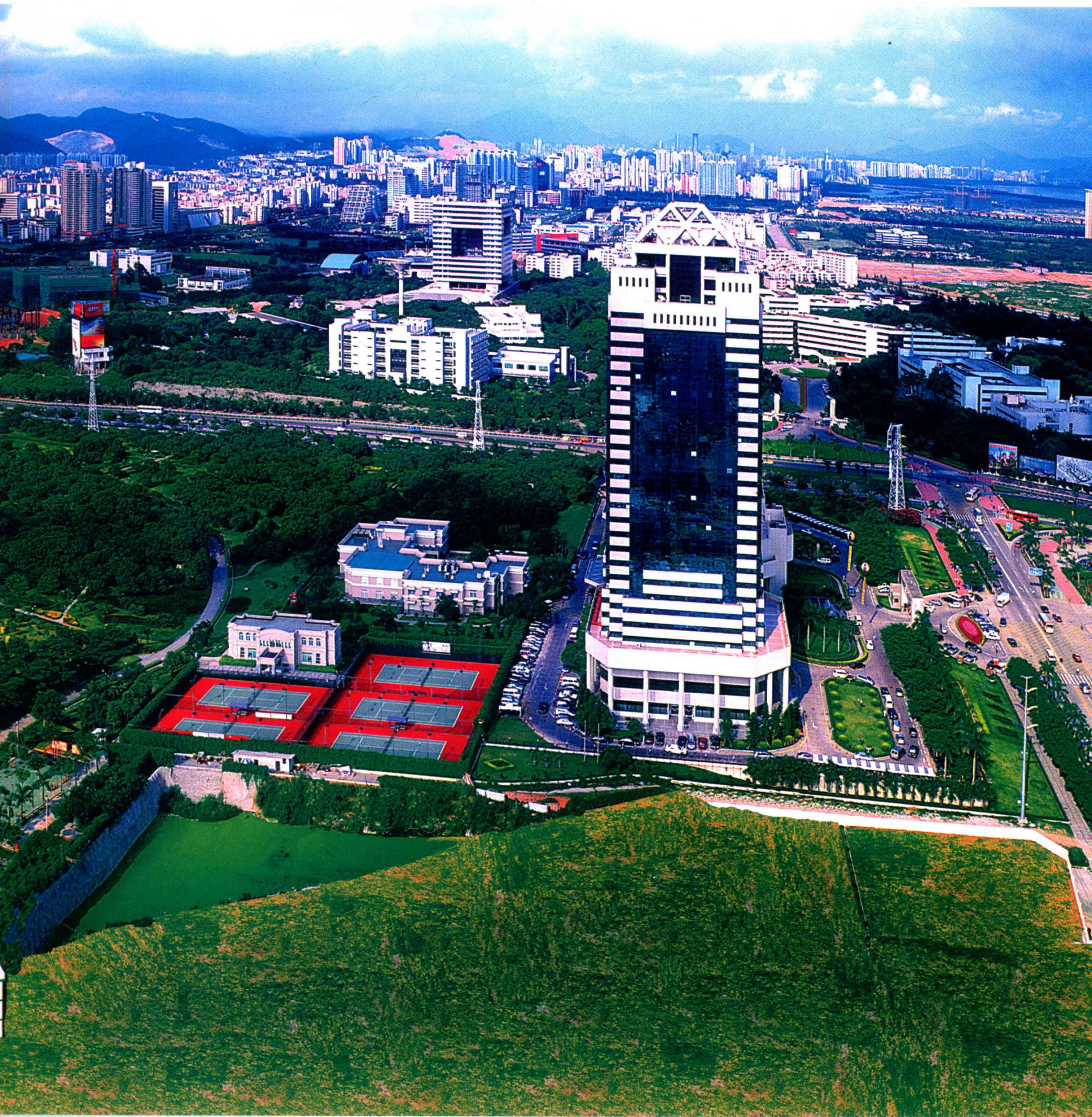
2003年南头片区