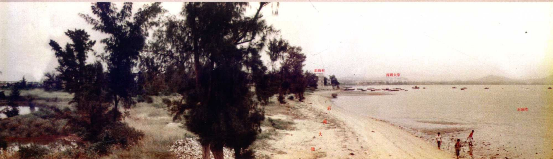
1984年后海片区