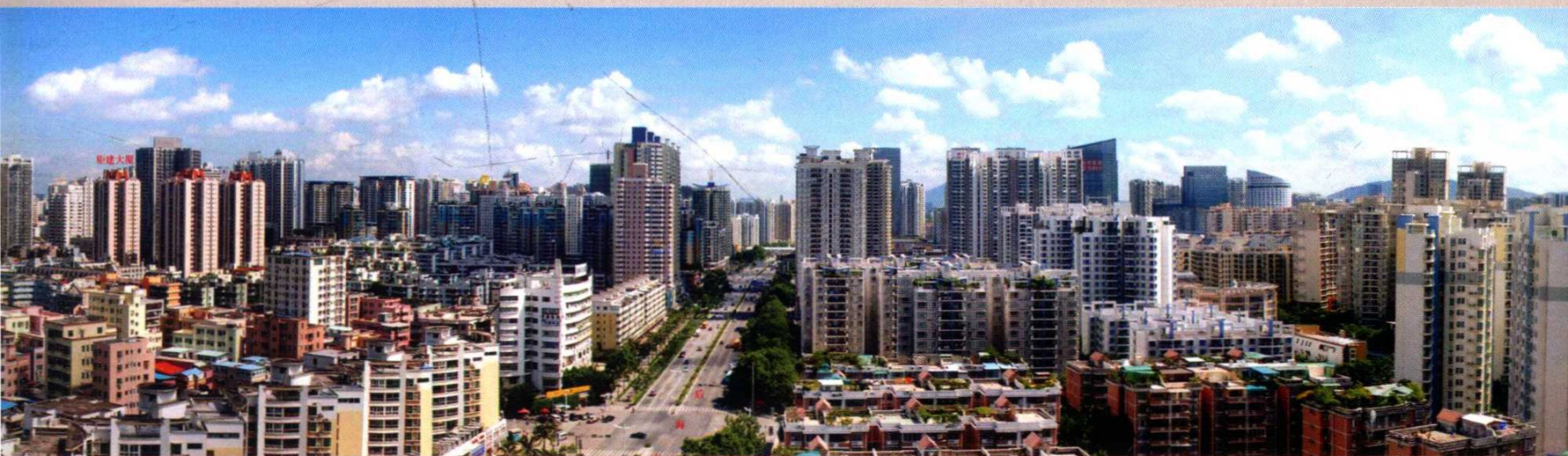
2005年后海片区