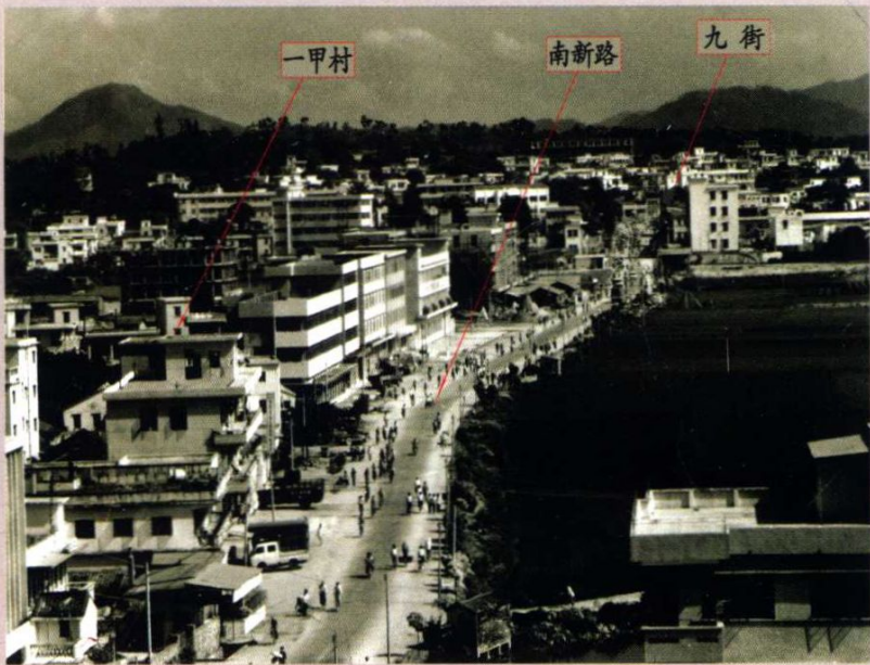
1984年南新路