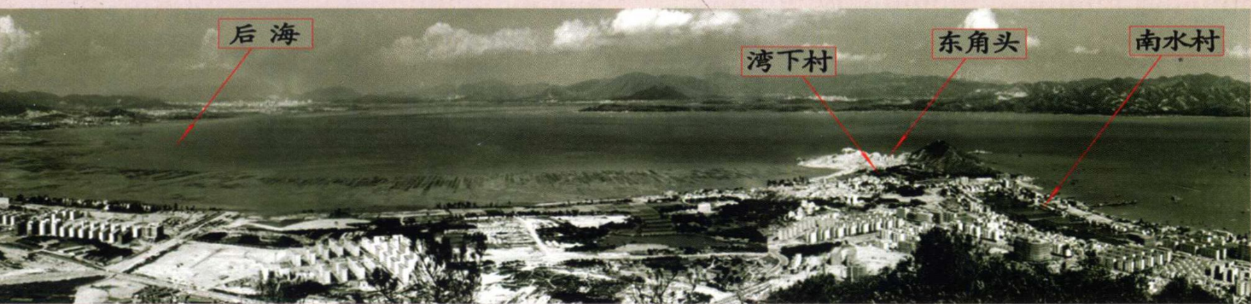
1984年从大南山鸟瞰南头半岛