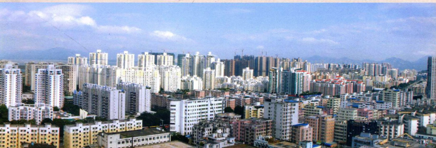
2003年深圳湾畔的南山后海片区