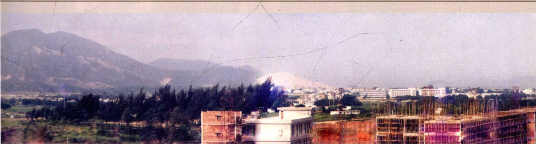
1985年南山商业文化中心区