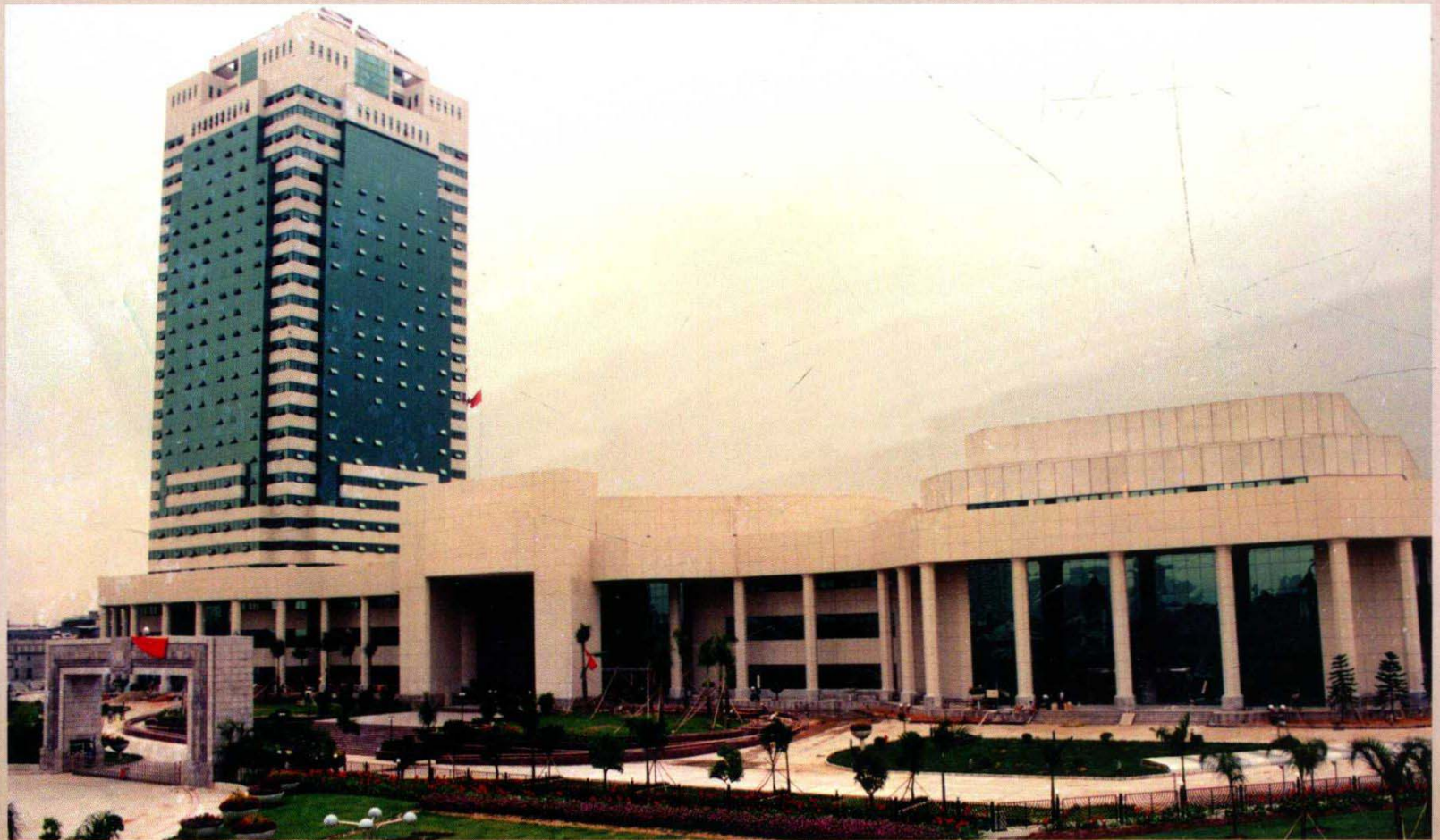
1998年3月后，南山区委区政府办公大楼