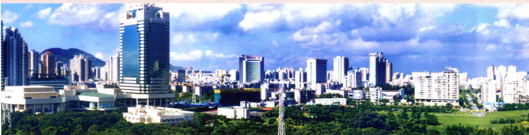
2003年深圳科技工业园