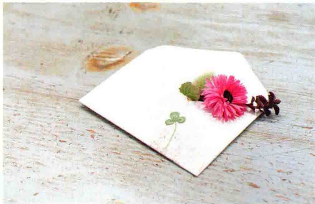
两人的合作：在青木女士的作品上摆放并木女士的插花。在银莲花的旁边加上了薄荷叶和兔草。