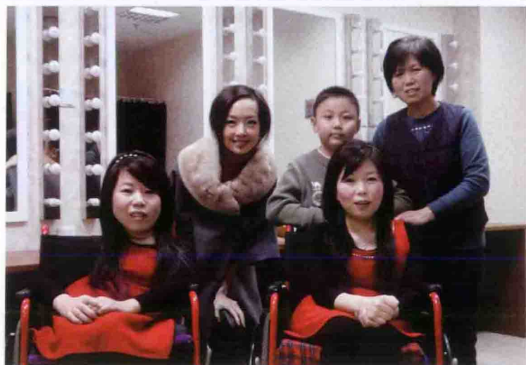
曼曼母女与鲁豫老师合影留念