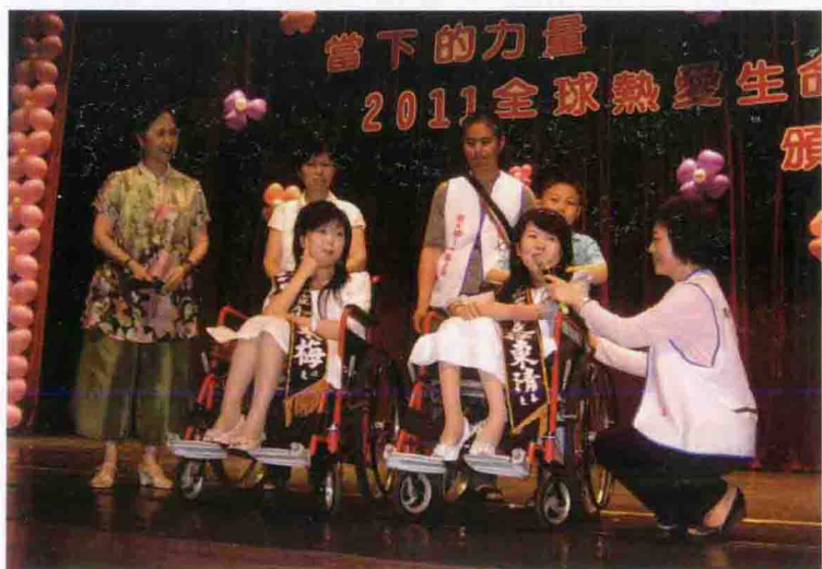
2011年5月25日在台湾接受第十四届全球热爱生命奖章颁奖