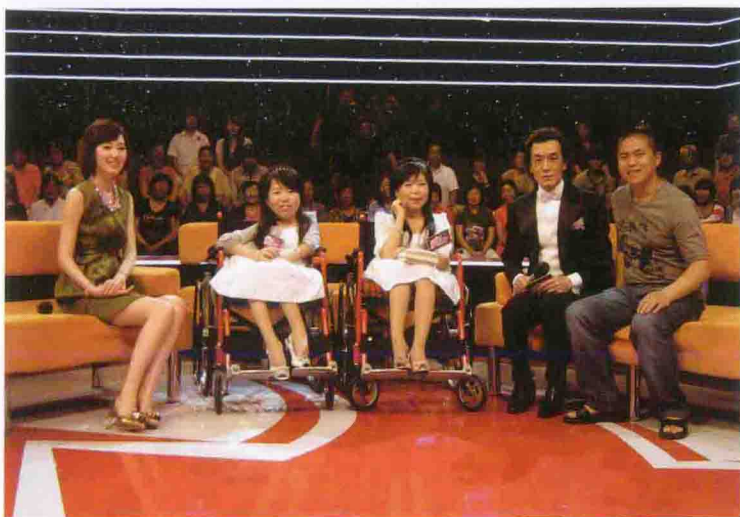
2011年6月录制 CCTV-3《向幸福出发》节目现场