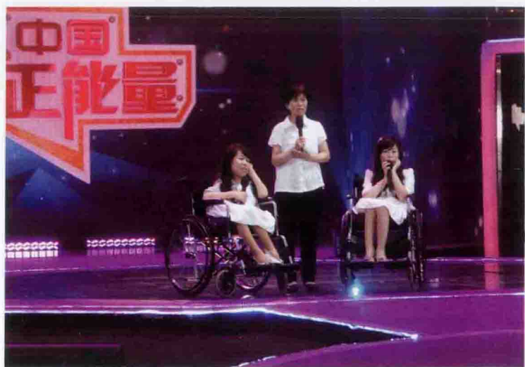
2014年6月在四川电视台《中国正能量》录制现场