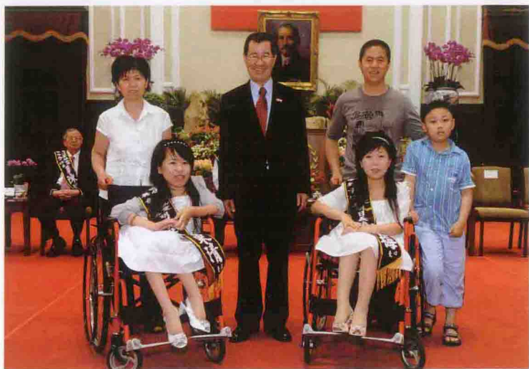
2011年5月27日在台湾总统府