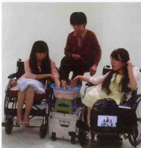
2014年5月11日在正能量演播室有生以来亲自为母亲洗脚