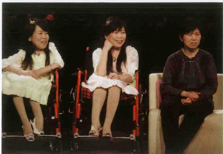
2012年3月录制《非常父母》节目现场