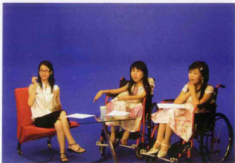
2008年9月录制《第一视频》现场