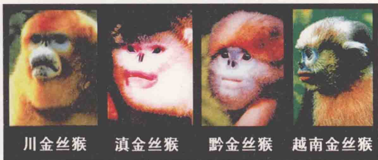
金丝猴的不同种类

在我国中部的秦岭大山中生活着这样一种动物：因为浑身毛色金黄，人们称它为“丛林中的金色精灵”，它们就是国家一级保护动物——川金丝猴。其中生活在秦岭山区的种群也被称为秦岭金丝猴。这到底是一群怎样的生灵？在它们的社会中，究竟隐藏着什么样的秘密？长期以来，笼罩在金丝猴身上的这些谜团一直无人能解。