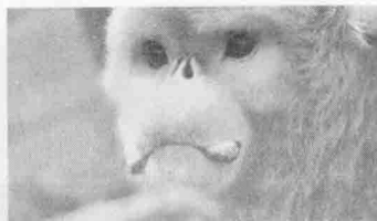
公猴嘴角长有肉突