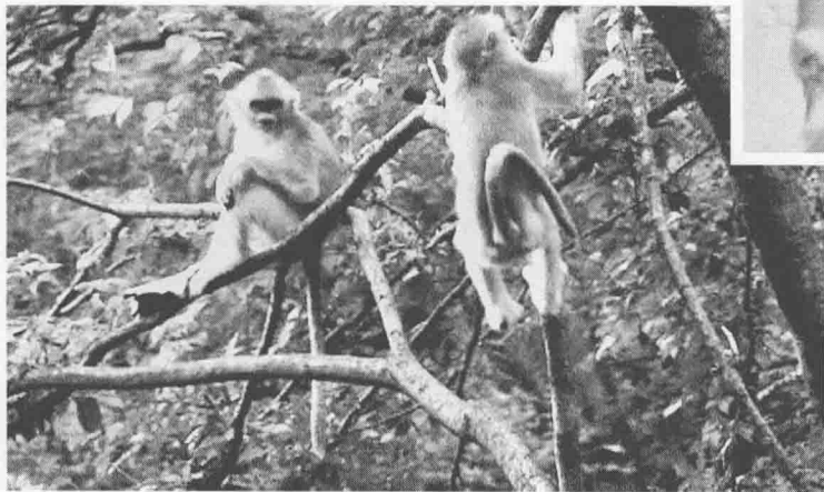
金丝猴在树间戏耍

在《太平广记》当中，也有这样一个关于金丝猴的故事，过去在剑南地区有很多人专门捕捉金丝猴的，他们的经验就是，只要捉到一个，就可以捉到数十个。为什么呢？一旦群体当中有一个猴子出了事情，这个家族的猴子就都