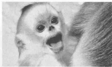
精灵般的小金丝猴