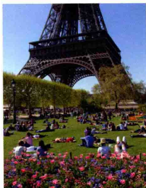
耸立在广场上的埃菲尔铁塔