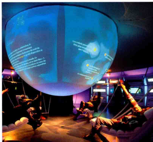
太空城的生物空间任务互动展，位于图卢兹

法国大受孩子欢迎的水族馆包括： 蒙彼利埃 （见 333 页）的 地中海水族馆 、 滨海布洛涅 （见 68 页）的 娜马西卡 、 拉罗谢尔 （见 286 页）的 水族馆 和 布雷斯特的水族馆 （见 162~163 页）。