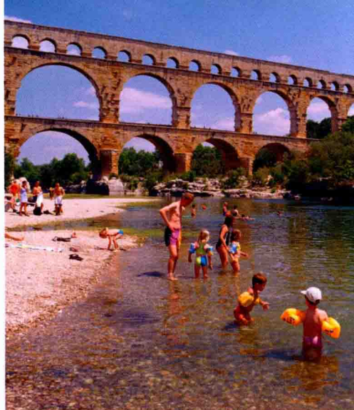
上图 加尔桥下的河流

法国壮观的山脉一年四季都吸引着家庭游客，有的是为了欣赏山脉的壮丽景色，有的是来参加山地运动。游客可以从法国的阿尔卑斯山乘坐缆车到达 南针峰 （见 224 页），它位于 勃朗峰 （见 224 页）下，是西欧的最高峰。如果只是想闲逛，可以探索 瓦努瓦斯国家公园 （见 230 页）的众多湖泊，或者前往风景如画的 阿纳西湖 （见 227 页）。游览比利牛斯山时，可以坐索道缆车到 比戈尔南峰 （见 306~307 页），那里景色壮丽；或去欣赏 比利牛斯山脉国家公园 （见 308 页）的瀑布。法国中央高原的自然奇迹包括：雄伟的 塔恩峡谷 （见 242 页）和 奥弗涅火山地区自然公园 （见 250 页）中的死火山。勃艮第的 莫尔旺地区自然公园 （见 206~207 页）有田园诗般的景色，而阿尔萨斯的 葡萄酒之路 （见 56 页）刚好经过该地区最漂亮的村庄。普罗旺斯的精华包括阿尔皮耶的橄榄园、梵高的画作，同样令人愉悦的还有朗格多克的 米迪运河 （见 330~331 页）。