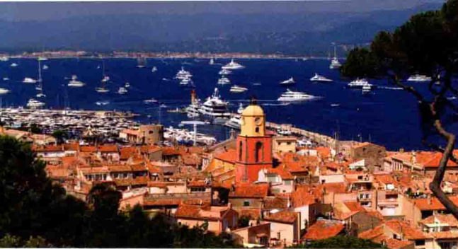
圣特罗佩的海湾和小镇的鸟瞰图