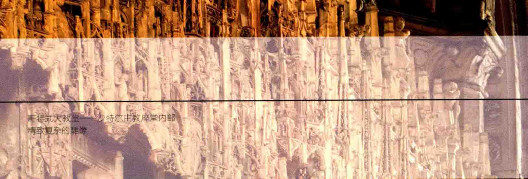
哥特式大教堂——沙特尔主教座堂内部 精致复杂的雕饰