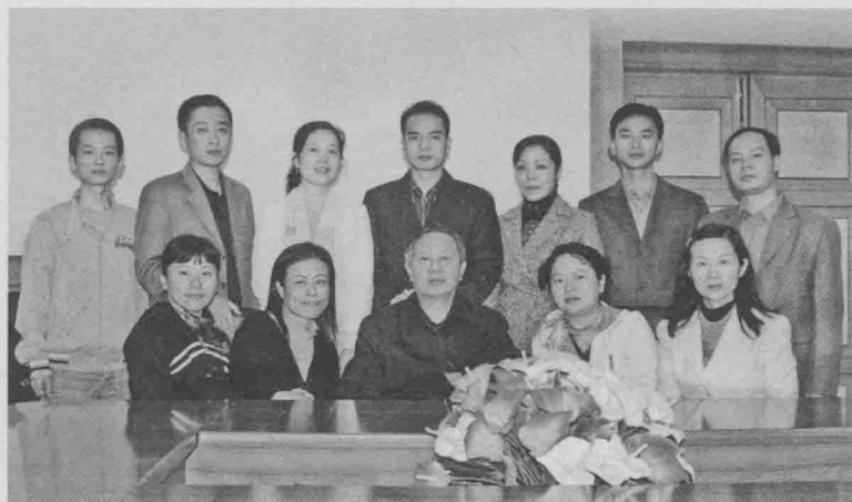
熊继柏学术思想与临证经验研究小组部分成员合影