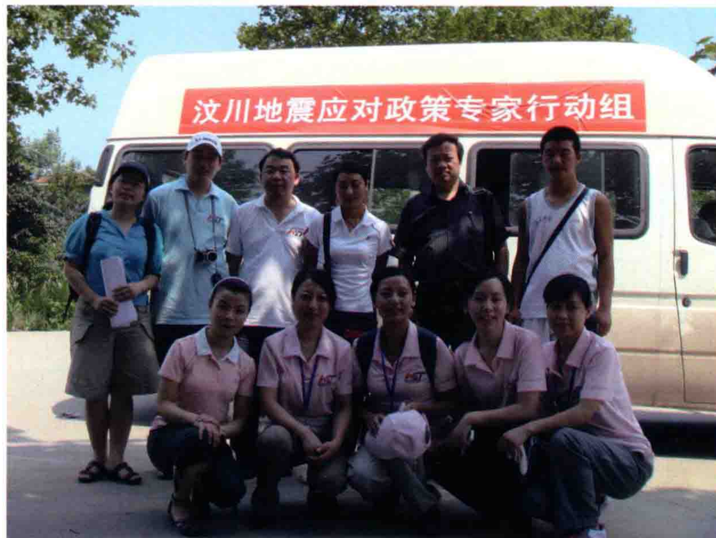
▲ 学校应对政策专家行动组成员合影