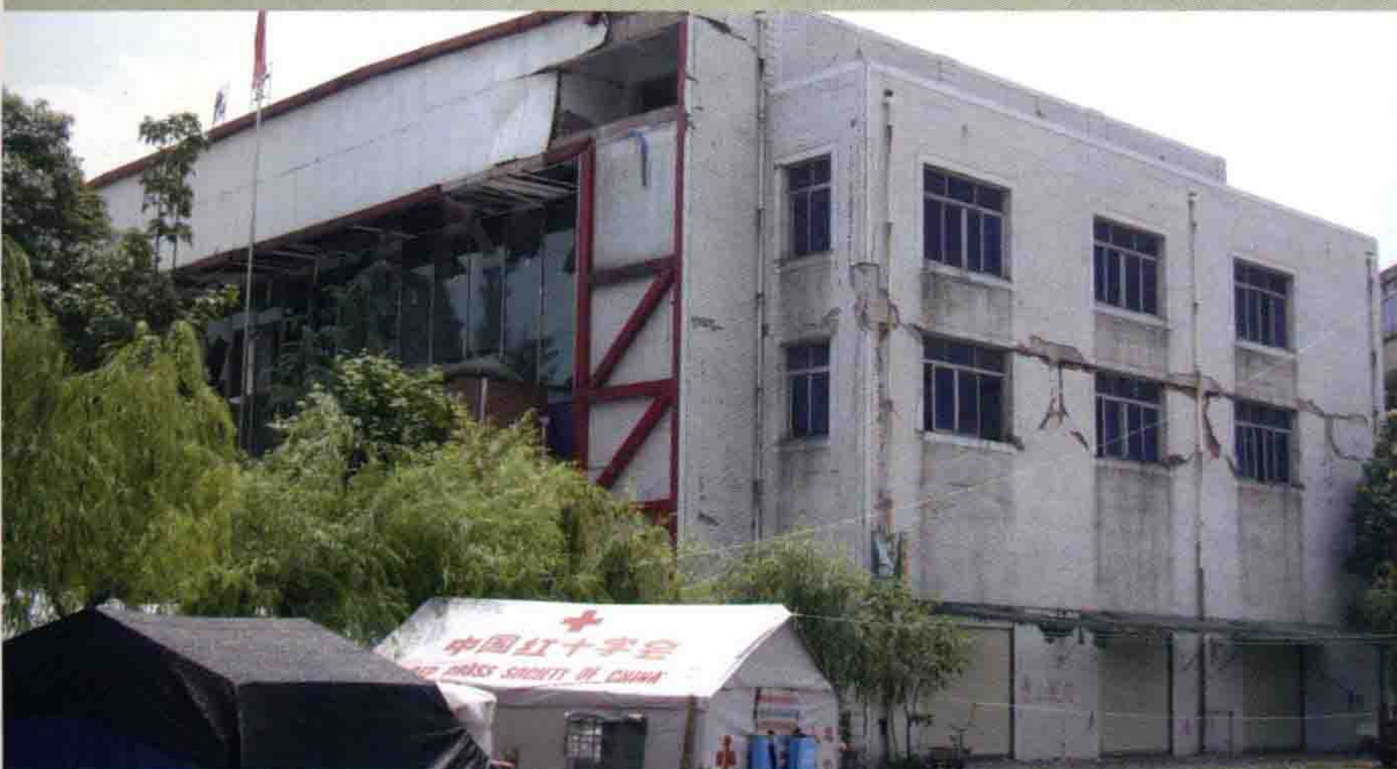
▲ 西苑中学被损礼堂一角