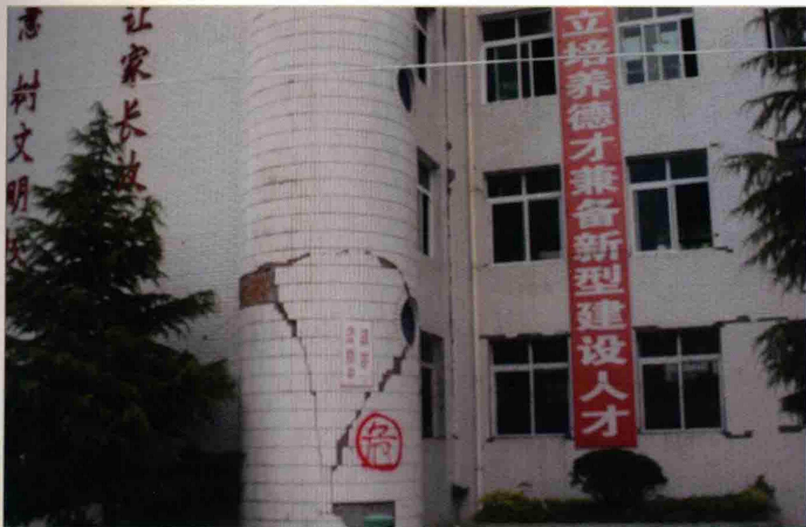
◀ 茂县中学的外墙伤痕累累