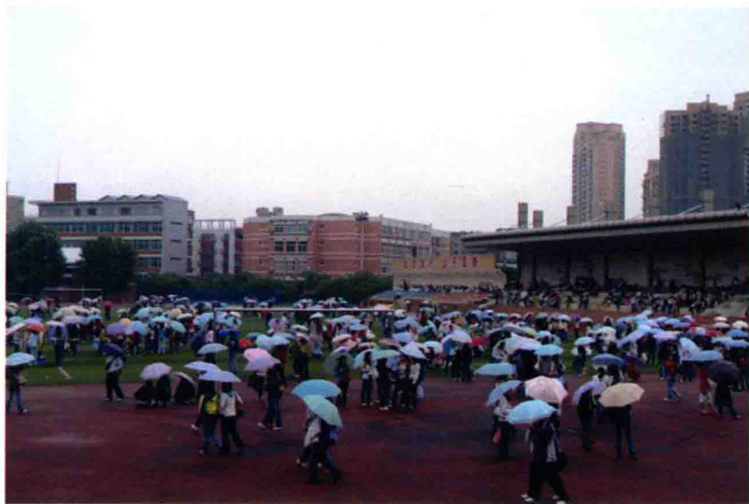
▲ 师生们在操场等安全地带

地震发生之时，正是我校上课时间。面对突如其来的自然灾害，老师们非常镇静，组织学生们有秩序地转移，不在教室上课的同学，也在学校相关部门的组织下，很快疏散到了生态广场与操场等安全地带。