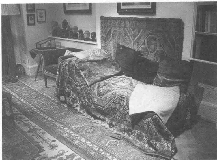
图1-3 弗洛伊德的咨询室