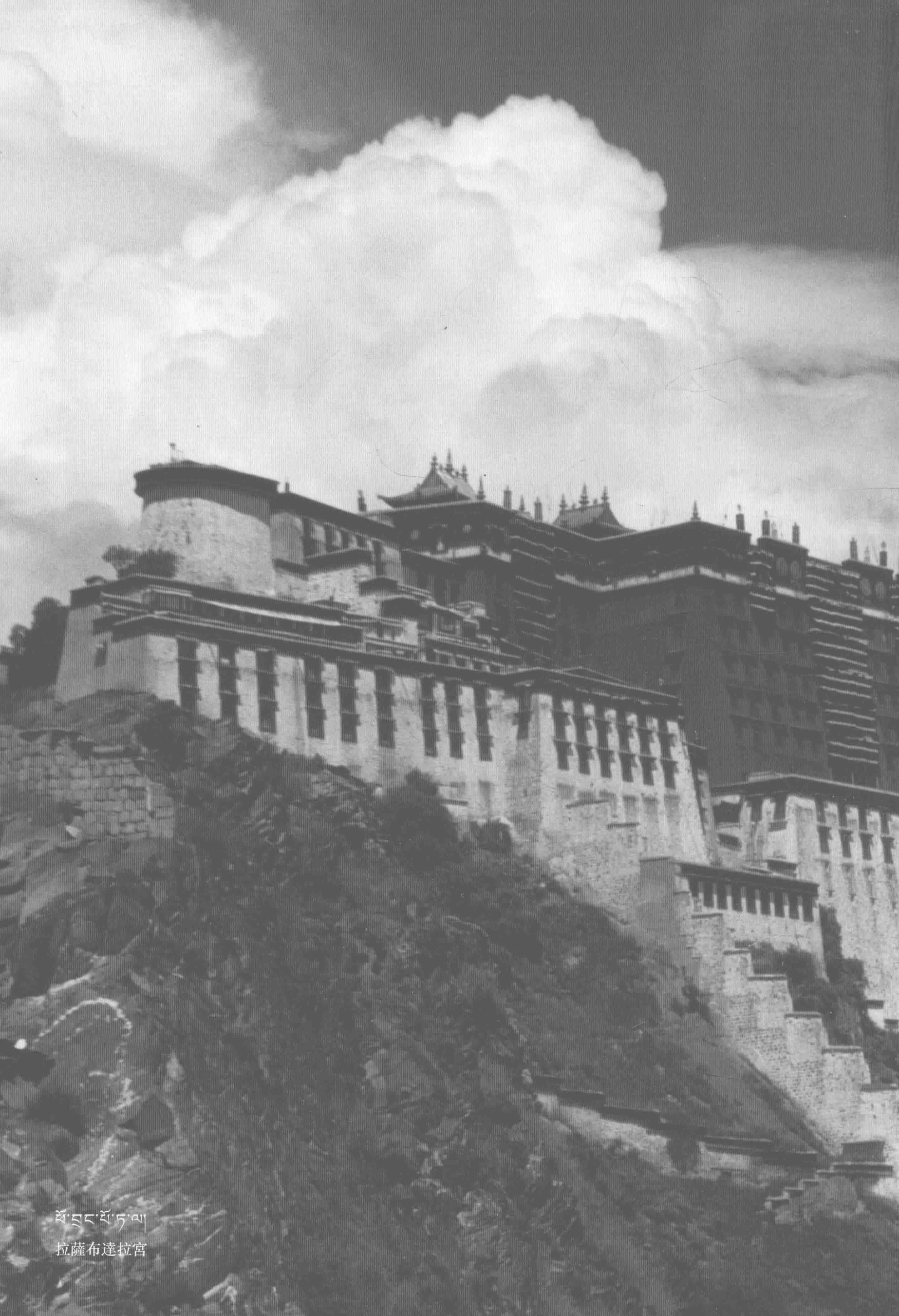
ཕོ་བླང་ཕོ་ཏུ་ལ། 拉薩布達拉宮