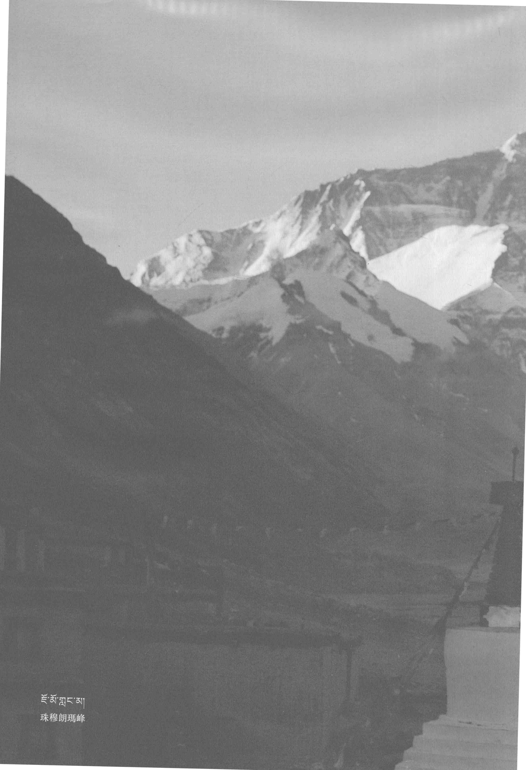
ཇོ་མོ་གླང་མ། 珠穆朗瑪峰