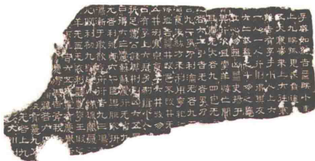
▼图1 《熹平石经·周易》残石(正面,拓本)

蔡邕(132~192),字伯喈,陈留圉(今河南杞县南)人,是东汉末年著名学者和书法家。据后人考证,当时共刻了《周易》《尚书》《鲁诗》《仪礼》《春秋》《公羊传》《论语》等7种经典,计46石。石为竖方形,高约为196厘米,加碑座通高231厘米,宽97厘米,每石刻文30余行,每行70余字,共刻经文20余万字。如此大的工程,当然不可能由蔡邕一人“自书丹于碑”,况且蔡邕在光和元年(178)便获罪流徙朔方郡,不久又亡命江海,居留南方十余年,并没有始终参与刻经之事。现代著名学者马衡先生曾依据有关资料,考证出参加校经和书碑者20余人,可见这一工程是集体的成果(图1、图2)。就在《熹平石经》刻成的第二年即中