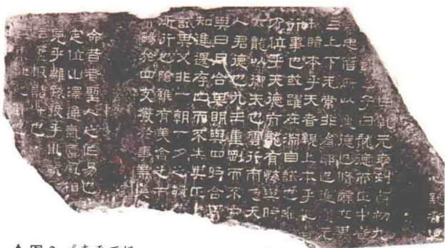
▲图2 《熹平石经·周易》残石(背面,拓本)

平元年(184),便爆发了黄巾起义。7年后的初平元年(190),又发生董卓之乱,刚刚即位的