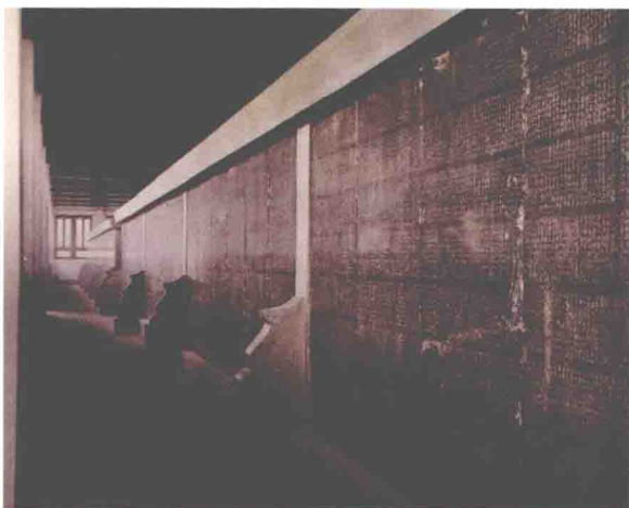
▼图5 展览室内的唐《开成石经》(旧照)

的多寡而定，均跨石刻成。这种碑文格式说明，晚唐时墨拓技术已经相当成熟，每列的高度，相当于当时纸幅的宽度，只须将拓本分列剪裁，即