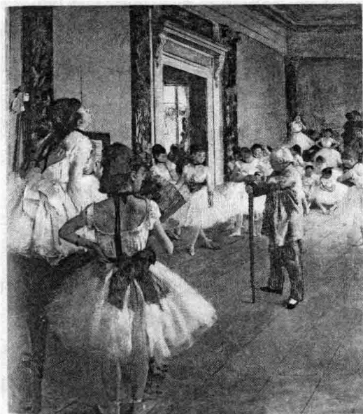
埃德加·德加油画《舞蹈课》 ①