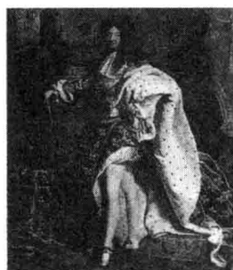
LOUIS XIV RIGAUD GUYANA $50

一部芭蕾史,上下五百年。芭蕾孕育在 15 世纪文艺复兴时期的意大利,成型并兴盛于 16 世纪至 19 世纪中叶的法兰西,鼎盛于 19 世纪末期的俄罗斯,然后从 20 世纪初的俄罗斯走向世界各地。