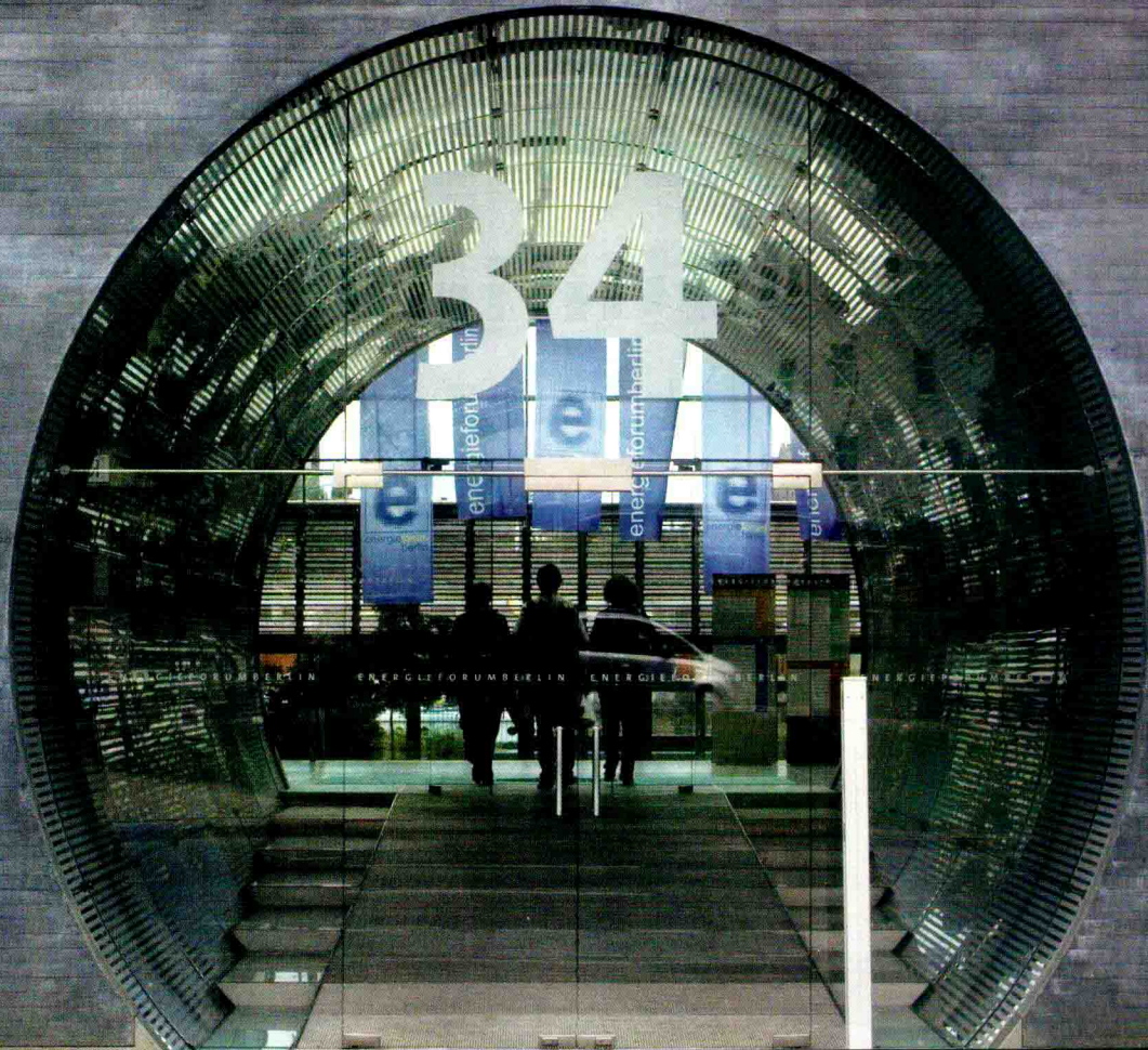
berlin, stralauer platz 34 (energieforum)