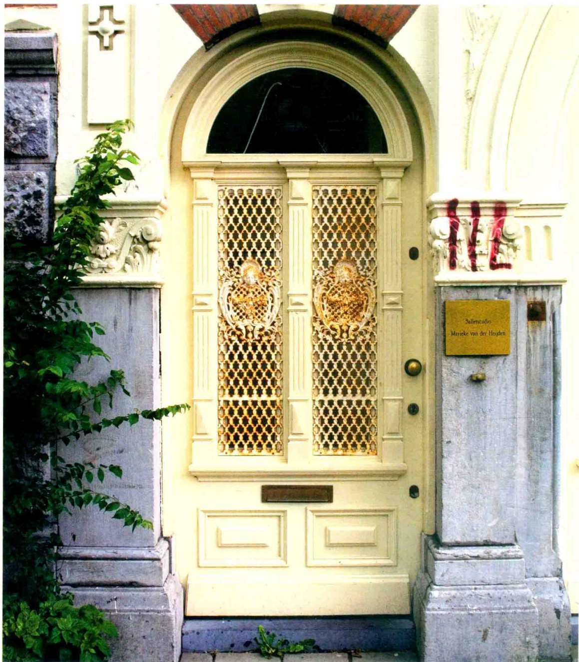
amsterdam, leidsekade 68