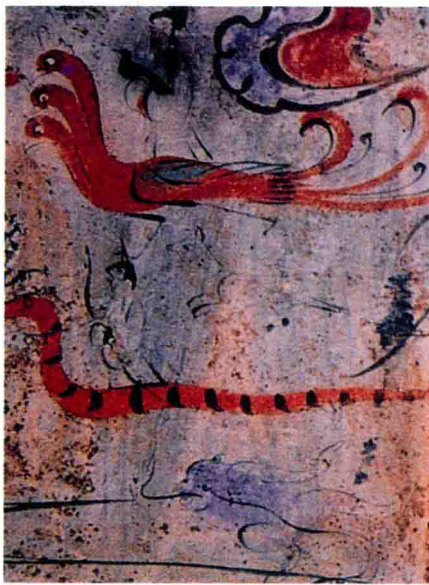
图1 西汉卜千秋墓夫妇乘蛇、乘风升仙图

秦汉时期是中国历史上神仙思想最兴盛的时代，在两位神仙思想最忠实的信徒和践行者——秦始皇、汉武帝的推动下，举国上下弥漫着浓厚的求仙风气。史书记载，这两位帝王任用方士，挥金如土，急不可待地命令方士们为他们寻求长生不老、羽化登仙的方法与途径。方士们为博取帝王的信任和金钱，非常卖力地编造出招