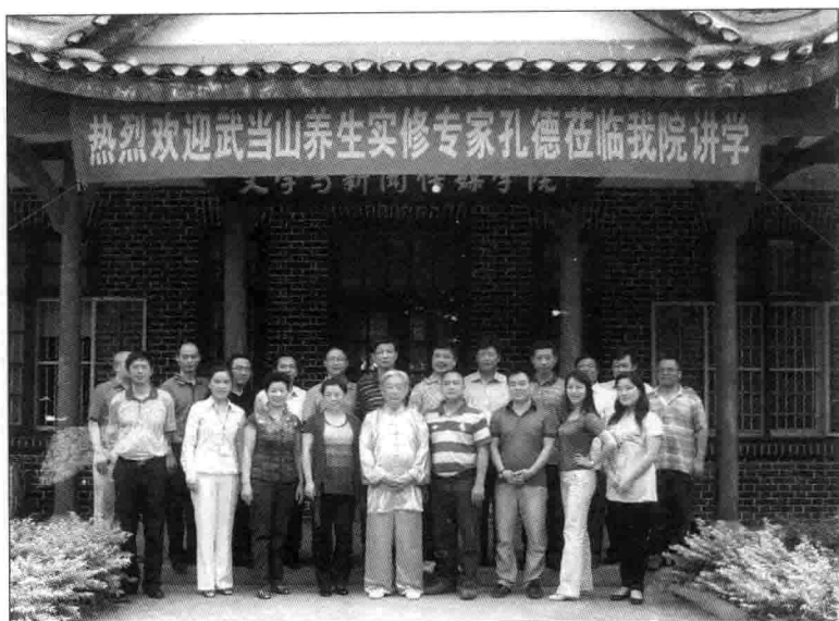
2010年孔德在重庆大学国学班授课与学员合影