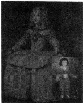
图 1-1 中世纪的绘画作品

这种观念在当时的艺术、日常生活和人们的语言中都有所反映。如果你仔细观察中世纪的绘画作品，就会发现画中所描绘的儿童在着装、表情方面都如同小型的成年人（见图 1-1）。16 世纪以前的玩具和游戏也是为所有人设计的，而不是为了逗乐儿童。至于年龄，这本来是现代人确认身份的一项重要内容，但在中世纪的风俗习惯中却显得无足轻重。人们每天的谈话中很少提到年龄。15 和 16 世纪之前，家庭和市政记录中也无此项内容（Aries, 1962）。可见，人们没有认识到儿童区别于成人的独特性，更不可能对儿童进行适当的教育。