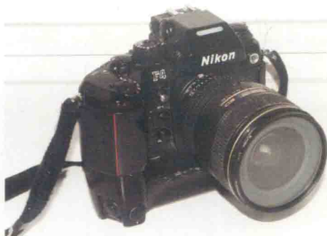
图1-2 单镜头反光相机(尼康F4-E传统相机)。

双镜头反光相机简称双反相机,有两支镜头,上方的镜头用于取景和聚焦,下方的镜头用于拍摄。所用的胶片通常为120胶卷。20世纪30年代至40年代的