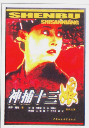
《神捕十三娘》简宁 路远 著