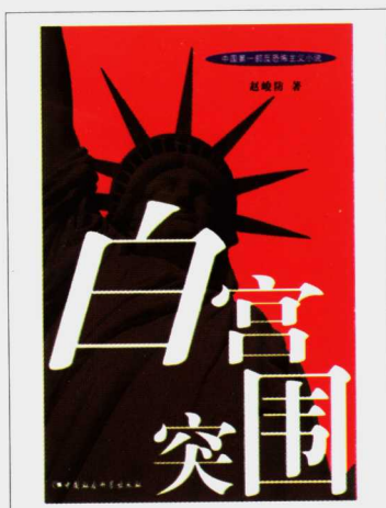
《白宫突围》赵峻防 著

北京嘉孚随图书有限公司 Beijing jiafusui Books Co.,Ltd.