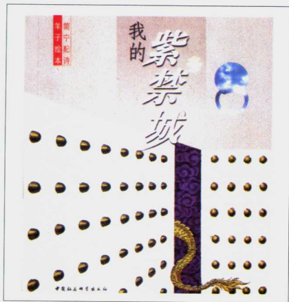
《我的紫禁城》兰子（绘）简宁（诗）