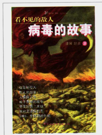
《病毒的故事》潘锋 赵彦 著