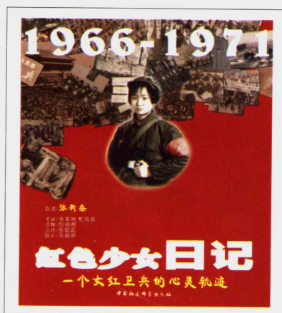
《红色少女日记》张新蚕 著