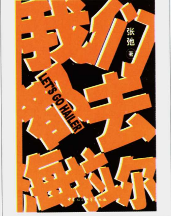
《我们都去海拉尔》张弛 著