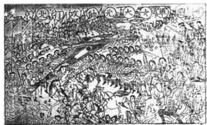
3. 民國軍女大元帥攻打北京城·安徽蕪湖

反映辛亥革命的木版年畫中，有一幅《民國軍女大元帥攻打北京城》（圖 3）。此幅原圖縱高 32 厘米、橫長 50 厘米，安徽蕪湖年畫作坊刻印。圖中所畫的人物多不見史傳，構圖背景也多不合地理常識，是民間藝人按照民間年畫藝術特點，隨心創作而來，却也反映了廣大農村對革命戰爭之意趣。畫面分作兩部份，左半部為清朝兵將護守北京城，發炮反擊革命軍。正陽門上“攝政王”（載灃）衣冠整齊，居高臨下在觀陣。正陽門外，張懷芝、姜桂題率兵迎戰不勝，作敗退狀；圖右為革命軍，徐武英為“女先行”，騎馬持槍當先，後有陣容整齊的女兵舉槍猛擊清營兵勇。“女元帥曹道新”坐騎白馬，舉令旗發號進攻。圖旁還有小字“一馬當先”、“勇氣百倍”，顯然是清兵陣營已亂，革命女兵將勝。最有趣的是遠處海上戰船數艘，水上刻有“熱河”二字，可說江南民間畫師未曾至京都，從想像中畫出。此圖畫版未見，刷印品僅存此幅，十分珍貴。