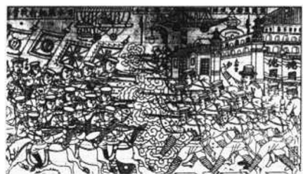
4. 日德爭戰青島·山東平度

日俄戰爭場地。昏聩的清朝政府宣布“局外中立”，劃遼河以東為交戰區，以西為中立區，開創了祖國領土上讓帝國主義者作戰的先例。繼之而起的是民國3年（1914年），日本與德意志兩帝國為奪中國山東青島展開的日德戰爭。賣國的北京政府，竟劃定山東黃縣龍口、萊州及膠州灣附近為日德交戰區。日本帝國乘機侵占了濟南東站，膠濟路全綫被日軍占領。在反映這場外國軍隊為爭奪侵占我國領土而戰爭的木版年畫，有《日德兩軍大戰青島圖》和《日德爭戰青島》（圖4）兩圖。這兩幅木版年畫繪刻成圖對教育我國後代勿忘國耻，痛恨前朝政府愚昧無知，把祖國土地淪喪，置人民生命不顧的歷史，永刻心中。因當時中國美術領域裏還沒有一位畫家敢于畫此重大題材，祇有民間美術裏的年畫藝術有此反映。《日德兩軍大戰青島圖》，為河北省武強縣年畫作坊刻印。畫面左方為日軍，陣前有步兵持槍衝鋒陷陣，中間夾有炮兵轟擊對方陣地，後方有督陣將官在舉槍遙射對方官佐；圖右是德軍陣地，炮兵當先，步兵壓陣，中間有指揮官督戰，陣後有一最高指揮官手舉望遠鏡遙望敵陣虛實，圖上還有雙翼飛機轟炸助戰，刻畫了中國領土上，被帝國軍兵任意破壞，人民塗炭之實況。《日德爭戰青島》與上圖構思相同，都是反映了日、德戰爭在我國領土，危及我人民生活安全之慘事。此圖為山東平度年畫作坊刻印，畫面較充實激烈。圖左，畫日本軍隊騎兵舉槍瞄射對方陣地，一騎馬持刀“司令部”將官在壓陣，軍旗上有“八卦”標志，是日本占領了朝鮮後，改名“韓國”之旗幟，逼朝鮮人民上陣之證據，“日”字方旗立于其後；圖右有德國“大都督”指揮步兵衝鋒作戰。圖上各有飛機助戰。上題“兩國不合（和）”、“日本飛艇打戰青島”、“德國飛船觀陣”。圖上硝烟瀰漫，炮火遮日，可知軍事之急，中國人民苦難之重！兩圖存世，足以喚起今後人們須知自相殘殺必遭外國凌辱欺侮的慘痛歷史教訓。