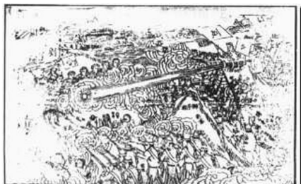
2. 南北兩軍大戰獅子林·安徽蕪湖