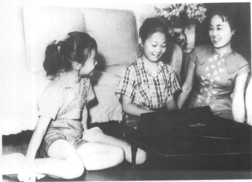
我望着两个快乐的小女儿，心想：但愿她们有免于恐惧的自由。