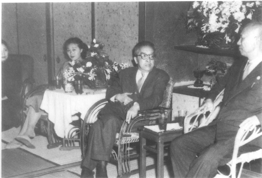
1952年，在雷震夫妇寓所，我在一旁静听胡适和雷震谈论国事。