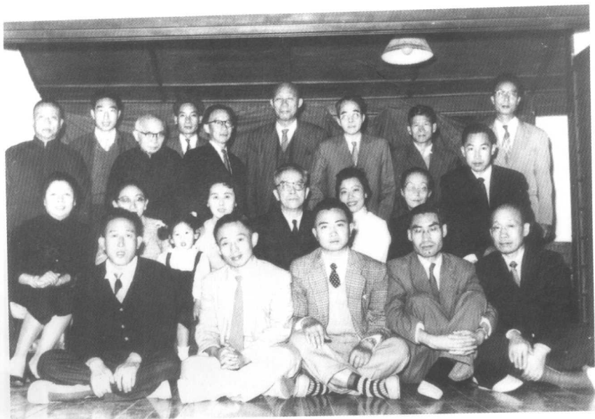
1958 那年，胡适和《自由中国》在一起。