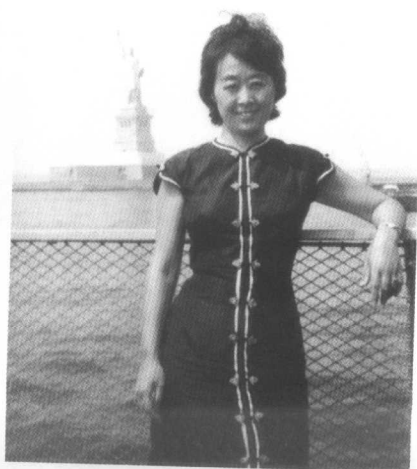
1965年,驶向自由女神像。