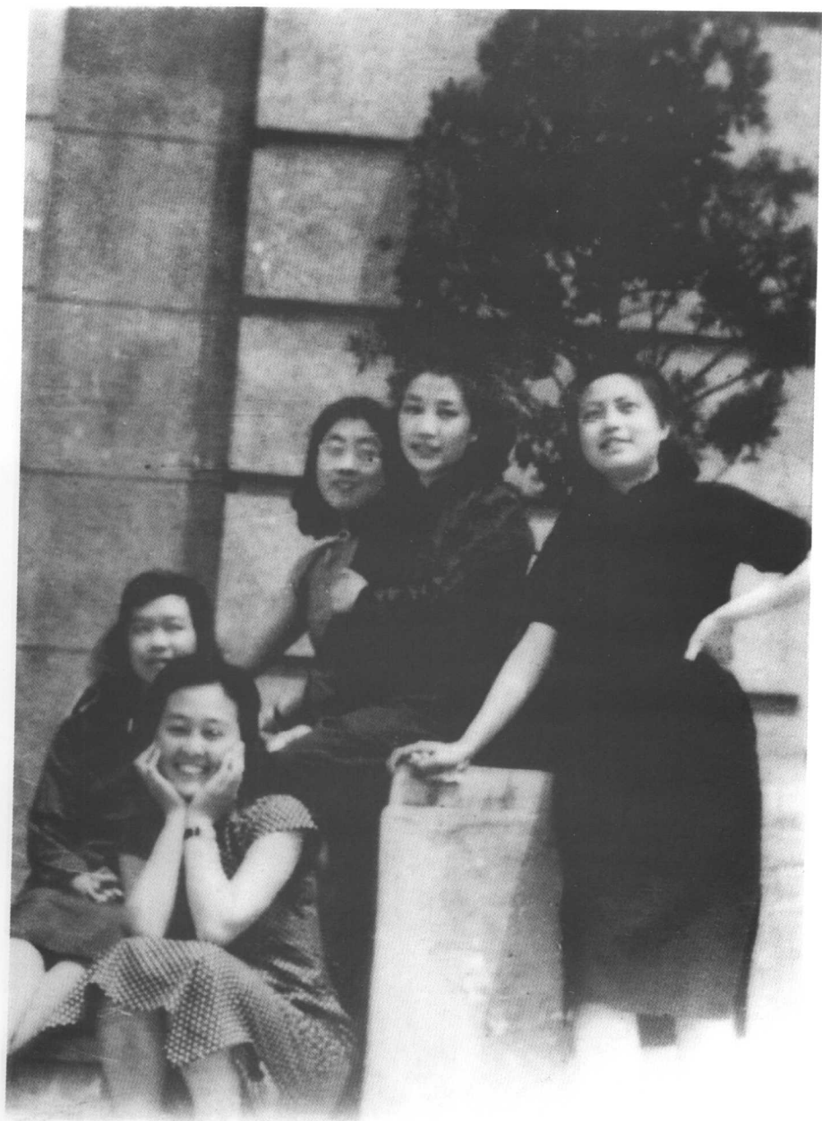
当我们年轻的时候——1946年,南京,国立中央大学