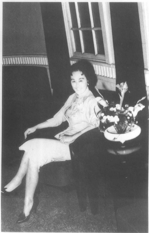
1952年，胡适从美国初次到台湾，在《自由中国》欢迎会上，朋友说：我给你照张相吧！