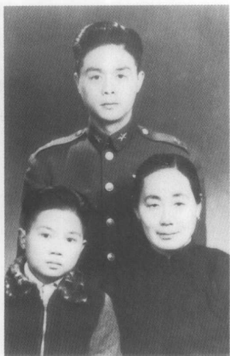
抗战胜利。汉仲平 安。母亲满足地说：我 们母子照张相吧！