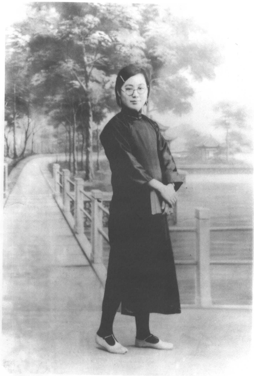
母亲要走又走不了。