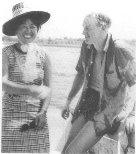
我俩在那条小船上。