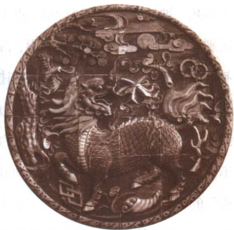
◎ 山西介休后土庙明代琉璃装饰

中国人的祖先黄帝、嫫祖，以及大禹、西王母等神仙都居住在昆仑。另一著名著作《列子·汤问篇》中说：渤海东面有一个叫做“归墟”的地方有五座山，分别称之为：“岱舆”、“员峤”、“方壶”、“瀛洲”、“蓬莱”，神仙就居住在这五座山上，并说每座山高和周长都有三万里，山的顶部平坦处有九千里，山与山相隔七万里，遥相呼应。山上的楼台馆所都是黄金与玉器所造，那里的鸟兽披挂着绫罗绸缎，山上有长满了珍珠、花朵和果实的树，人吃了能够不老也不死。居住在那里的都是神仙，他们飞来飞去，相互交往，有不计其数。汉代著名史学家司马迁在他的《史记·封禅书》中也说，春秋战国时曾有许多国王诸侯派人出海去找蓬莱、方丈（“方丈”即“方壶”，见辞海“方丈”条，另见史记《封禅书》）、瀛洲三座神山。相传这三座神山在渤海之中，相去并不远的地方。但快要到达时，船往往被一阵风刮走；如果到达了这三神山，就可以看到了居住在那里的神仙，并找到不死之药。在未达到时，三座神山望过去好似云彩；到达后三座神山实际上在水下。这些派去