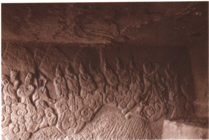
◎ 陕西道川元代道教浮雕造像

的恩赐；如果歉收，那就是大自然神灵对人的惩罚。由于天气对农业生产至关重要，它高深莫测，并统揽了整个宇宙，人们把天看成是至高无上的神。由于太阳给人带来温暖、光明，影响着白天与黑夜的更替，关系到一年四季春夏秋冬的变化，因此也特别崇拜太阳神。由此，扩大到对一切认为与农业生产有关的其它自然现象，如土地、月亮星辰、风雷雨电、山河湖海、草木鸟兽等等，也都加以崇拜。从中国新石器时代（约公元前5000年—公元前2000年）几个考古遗址——山东省泰安大汶口文化遗址、浙江省余姚河姆渡文化遗址、甘肃省临洮马家窑文化遗址等地已发掘出土的器物上，都绘刻着表示对天体日月星辰崇拜的图形。祖