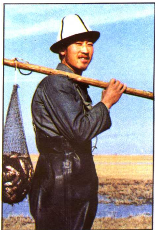
柯尔克孜族男青年