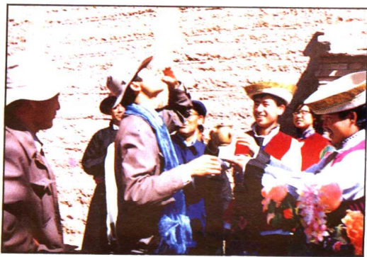
土族人用青稞酒敬客