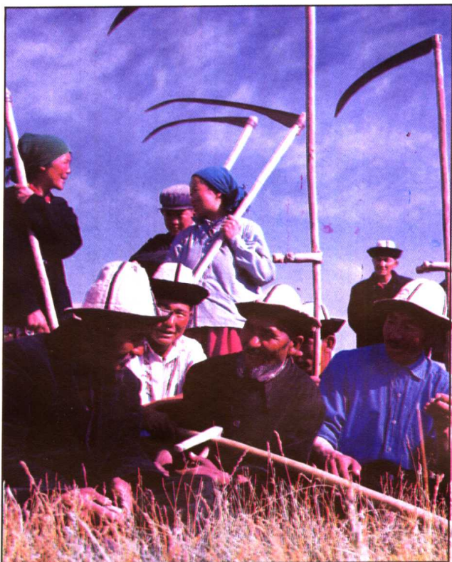
柯尔克孜人打草间歇