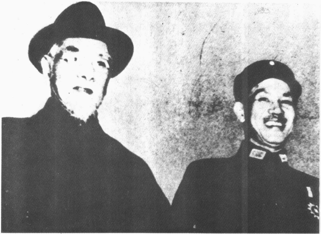
實際上，林森主席一點權力也沒有。