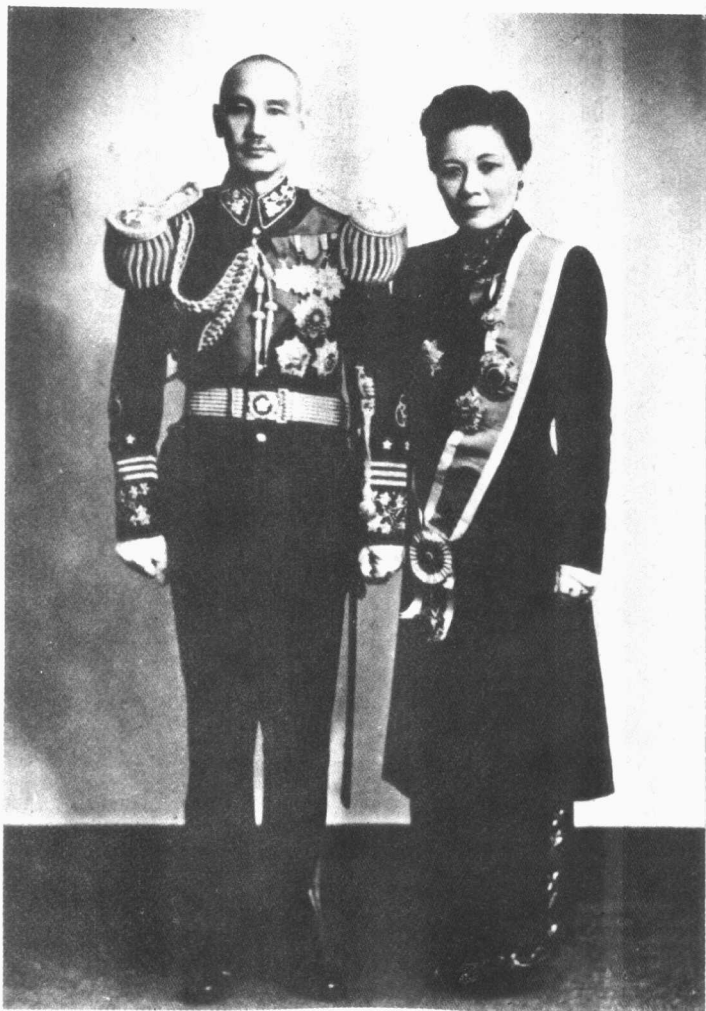
蔣介石就任國民政府主席。