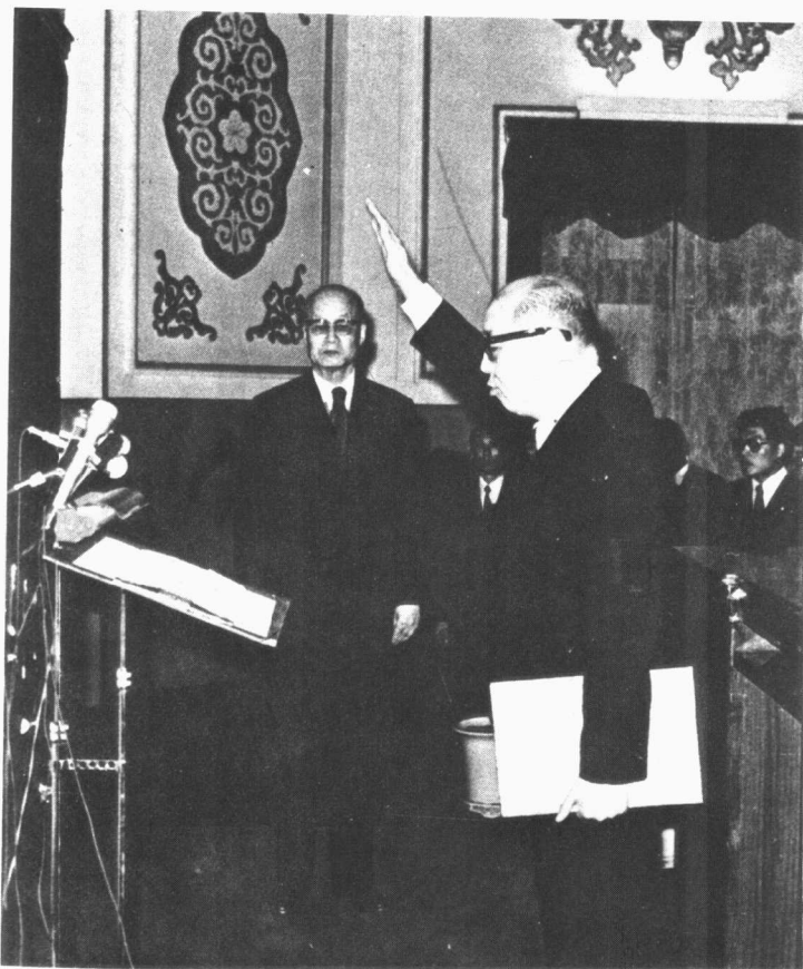
嚴家淦繼任了空頭總統。