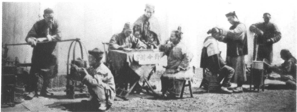
清末江西九江街头情景