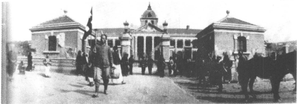
湖北军政府大楼，原湖北省咨议局

难。有人拿出一份预先写好的安民告示，要他以都督名义在上面签字，惊魂未定的他就是不肯落笔。在场的革命党人李翊东大怒，拔出枪来厉声呵道：“你这生成的奴性，还想戴满清的红顶子，我先把你杀了，再来推举其他人。”黎元洪浑身颤抖，缩头不语，最后李翊东代签了一个“黎”字，才将告示张贴出去。10月11日下午，这份告示迅速传遍武昌，人们奔走相告，都说黎元洪也参加了革命，实际上黎此刻还没这个心思。当晚，湖北军政府正式宣告成立，都督黎元洪，由谋略处暂时执掌军政大权，未遭战火破坏的省咨议局暂时辟为军政府办公处。